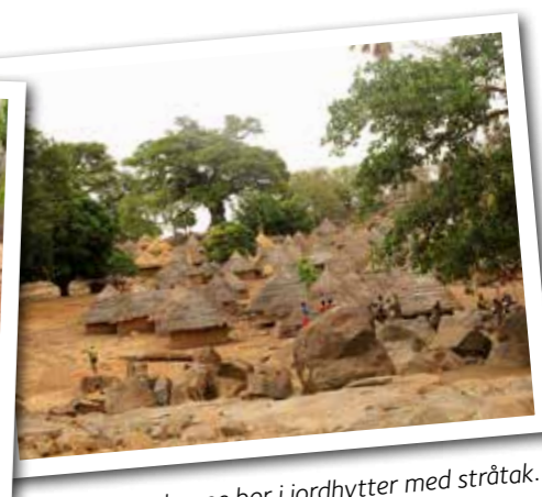
Noen av naboene bor i jordhytter med stråtak.