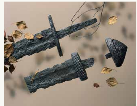
Våpen: Gamle sverd er funnet ved flere gårder på Byåsen, det nederste av disse to er fra Stavne.

Når historikere og arkeologer vurderer bosettingen i et landskap, er navnet på gårdene viktige kilder til kunnskap. Gårder med landskapsnavn i ubestemt form, er gjerne eldst, f. eks.: Dal, Li, Berg, Vik og Sand. Ofte er disse gårdene størst og ligger på de beste boplassene. Munkvoll, Havstein og Stavne er mulige eksempler på slike navn. Forstavelsen Munk- ble trolig lagt til da munkene på Nidarholm ble eiere av gården Voll? Havstein kan ha hatt navnet Stein fra starten, selv om varianter av navnet Havstein opptrer tidlig i gamle skriftlige kilder. Stavne-navnet blir også forklart som en landskapsform. Den