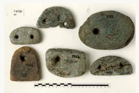
Kvinneredskap: De fine vevloddene er funnet ved Våddan, muligens ble de en gang plassert i en kvinnegrav.

-Lenge før Trondheim ble en by mot slutten av 900-tallet, trengte befolkningen på Byåsen veier mellom gårdene sine. De trengte også veier sørover til Gulosen og nordøstover til Øreting og gudehøvet på Lade, fastslår Beverfjord. Hun synes det er lett å se dem for seg, både formødrene og forfedrene, der de tok seg fram gjennom det frodige kulturlandskapet vest for Nidelva, med utsikt til fjorden, en annen viktig ferdselsåre for folk og varer.