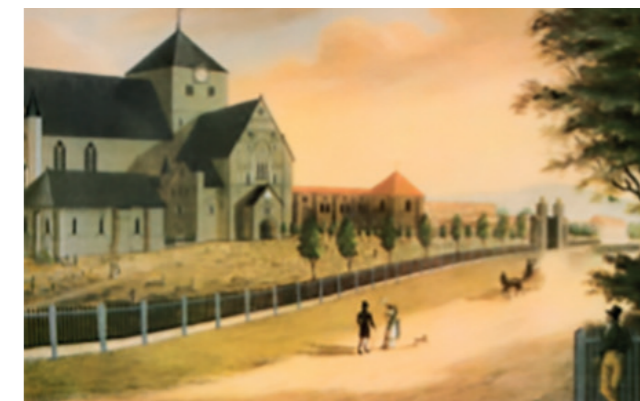
FOTO DOMKIRKEN ca 1830 - Trærne langs gjerdet kom fra planteskolen på Kystad

Kartet over «Kystadparken»; landskapsparken, er omtalt i boka Norske hager utgitt i 1917. I parken var det stier, lysthus, kaminer og et 20-talls hagebenker.