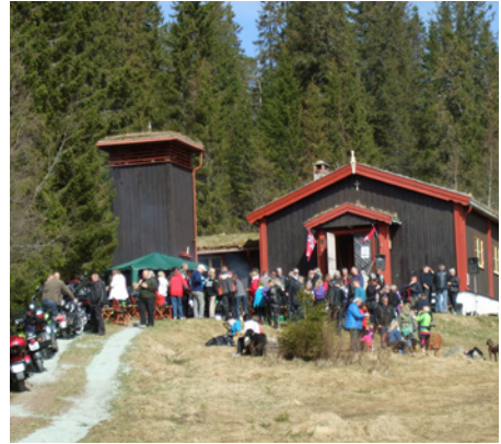
MC-gudstjeneste i regi av Holy Riders 11. mai 2014

Kapellet, som er tegnet av arkitekt Hermann Semmelmann, er bygget i flott tømmer og har et interiør med sterke farger som gjør rommet lunt og trivelig – med en peis som varmer. Det er møblert med budalsstoler og fastskrudde bord hvor folk kan benke seg til gudstjenester, kirkekaffe, møter og selskaper. Mange har undret seg over disse bordene midt i kapellet, men hva er vel et bedre symbol på fellesskap enn et dekket bord folk kan samles rundt?