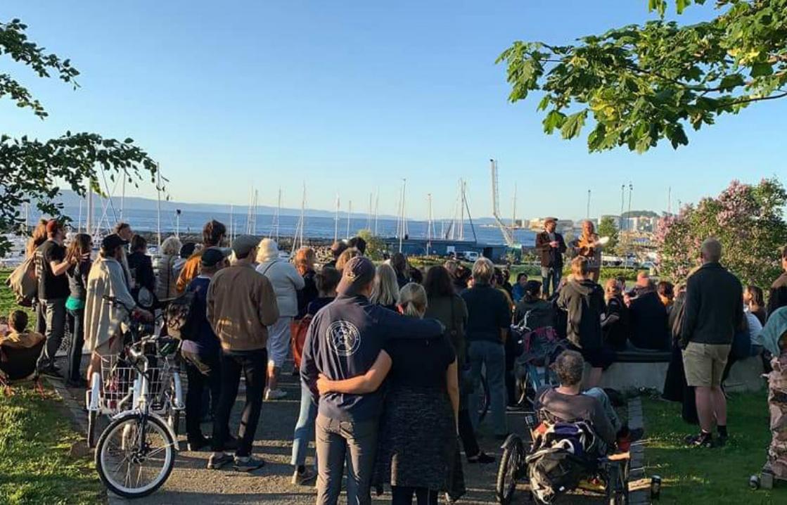
Harakiri Band spiller rundt «Bålet på Skansen».

aktivitetspark», en serie arrangementer først og fremst ment for barn. Disse aktivitetene knuste også myten om at Iladagan bare består av godt voksne rødvindrikende kvinner.