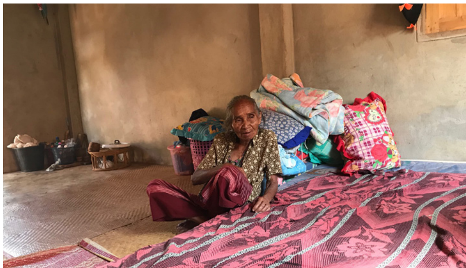
På besøk. Når skikken er å sitte på gulvet, trenger man ikke mange møbler

animisters møte med kristendommen. Kristendommen fikk dermed raskt fotfeste, og de siste 12 årene er det over 1300 som er døpt. For en tidligere japanmisjonær som meg høres det ut som et eventyr. I Japan opplever nemlig det lutherske kirkesamfunnet vårt under 30 dåp i året. Blant Lua-folket er det nå bygd 11 kirker. I tillegg er det steder der man har gudstjeneste, men ikke har kirkebygg og heller ikke er organisert som menighet ennå. Så skulle en jo tro at det må være mange prester, men for tiden er det bare én. Han er misjonær fra Madagaskar, og som gassere flest har han et langt navn, men forkorter det til Tovo.