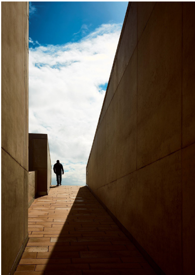
«Moesgaard» av Kristoffer Wittrup