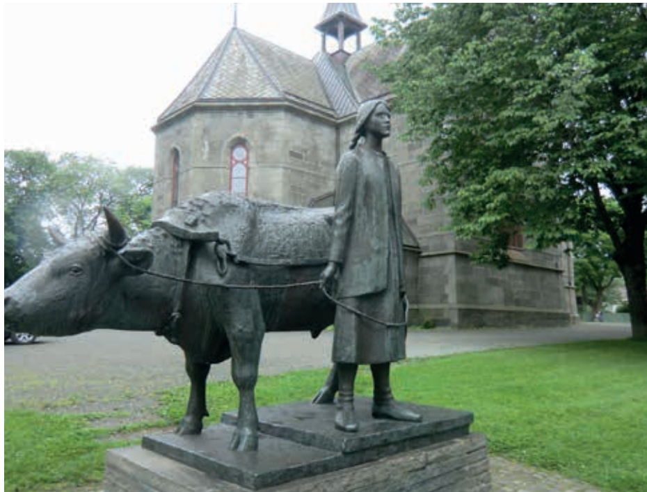
Johan Falkbergets An-Magritt med Hovistuten. Statue laget av Kristofer Leirdal.

Sammen skal vi bære barnet og hverandre til kilder som gir liv og tro og åpne rommene så vi kan ta imot, som når klokkene ringer og lyder gjennom røkåpningen i taket til Kiempens hus. Så barnet kan vokse opp, himmelvendt, med skjørt som har lettet fra bakken.