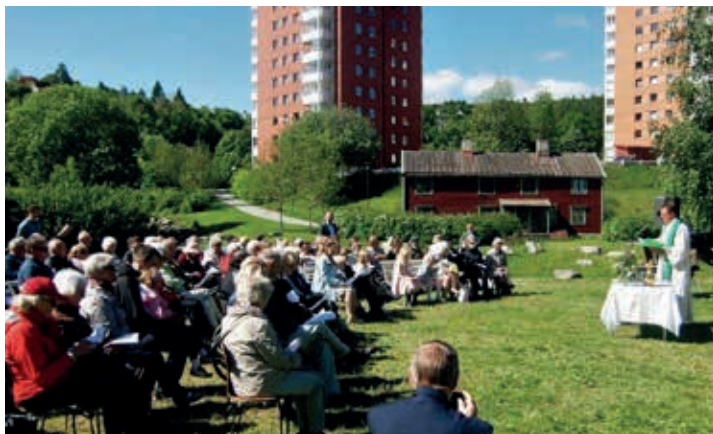
Friluftsgudstjeneste i Iladalen