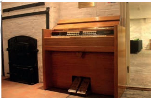
I Kirkestua: Vestre trøorgel