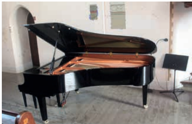
I lens Yamaha C7x-flygel