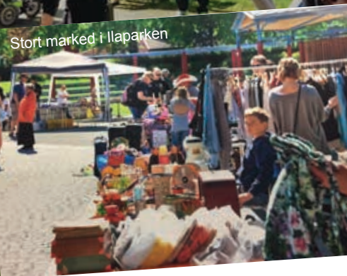
Stort marked i Ilaparken