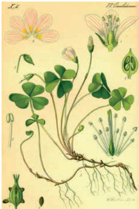
Oxalis acetosella. Wikimedia commons, Otto Wilhelm Thomé (1885)

Vi løfta hovudet og møtte blikket til gaukesyreblomar som blunka mot dagen. Avventande.