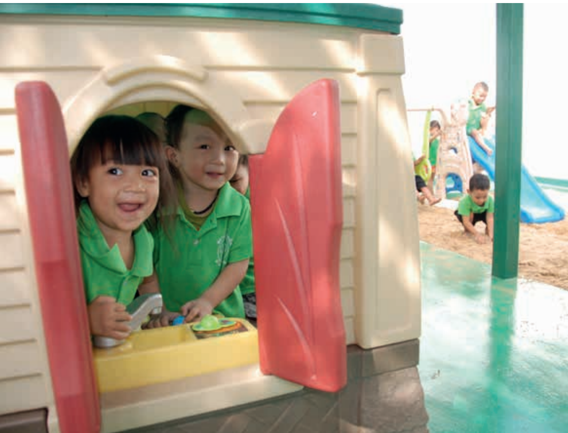
Glade barn på Lovsanghjemmet.

inntektskilde til prosjektet. Hovedbestanddelen i disse lysene er lysstumper som blir samlet inn. Lysene er hånddyppet og gjennomfarget. Alt arbeid blir gjort av frivillige. Misjonsutvalget organiserer salg av disse lysene, og overskuddet går i sin