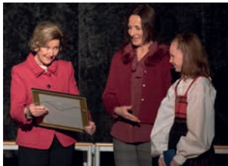
Dronning Sonjas skolepris 2016.

Skolegudstjenesten , hva med den? Her henviser rektor til brukerrådet, skolens høyeste rådgivende organ som består av foreldre og elever. Brukerrådet ønsker at skolen skal holde fast ved de tradisjonelle skolegudstjenestene. Men rektor som