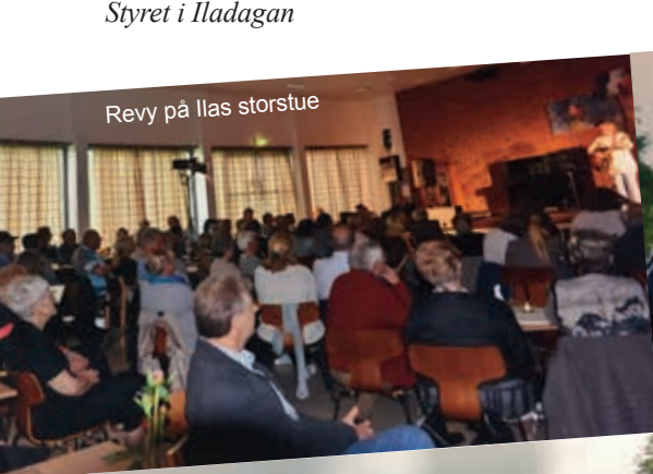
Revy på Ilas storstue