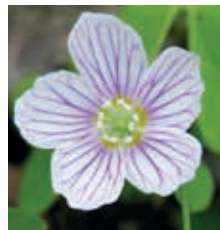
Oxalis acetosella.