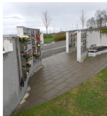
Nye Tiller kirkegård.