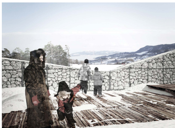
Ill.: 'Alle savnedes plass' nær anonym minnelund

I forbindelse med etablering av Charlottenlund gravlund, inviteres det til åpen prekvalifisering for oppdraget med å tilføre et kunstneriske uttrykk til den anonyme minnelunden. Prosjektet er rettet mot profesjonelle kunstnere, enten alene eller i samarbeidende grupper. Det søkes etter kunstnere innenfor et bredt spekter av uttrykksformer, materialbruk og kunstneriske strategier.