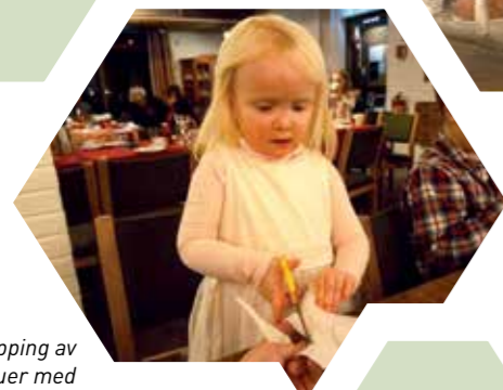
Klipping av fredsduer med litt hjelp fra bestefar

Den 6. januar, selveste hellige tre kongers dag, feiret vi juletreffest / Hellige-3-kongers-fest i kirken.