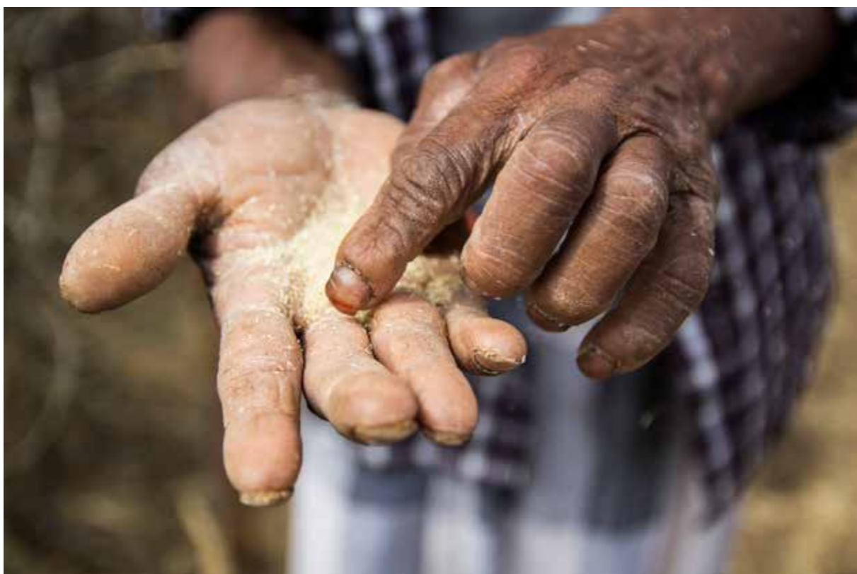
Den knusktørre jorda gjør det umulig å få avlinger som kan selges videre på markedet.