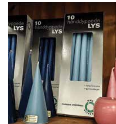
På basaren i kirka er det et stort utvalg av hjemmelaga "gobiter". Her fra en tidligere basar.