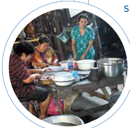
Dugnadsgjengen starter tidlig på formiddagen med å lage mat til julefesten.

Hvis du vil være med og støtte misjonsprosjektet i Thailand, kan du bruke konto 8220 02 85057, eller VIPPS 78533. Merk med "Gave til misjonsprosjektet".