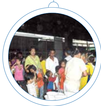
Varm mat hører hjemme på julefesten!