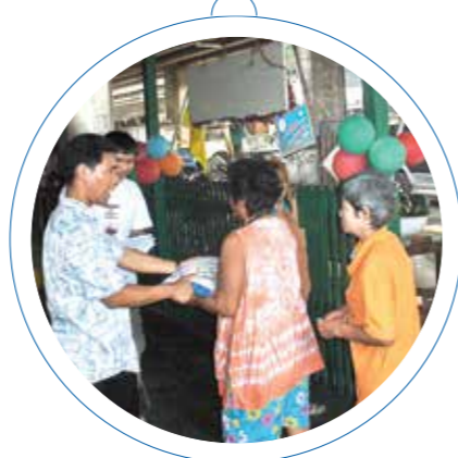
På Lovsangshjemmet deles det ut ris til de eldste av beboerne i Klong Toey-slummen.