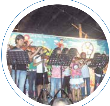
Etter maten står underholdningen for tur.