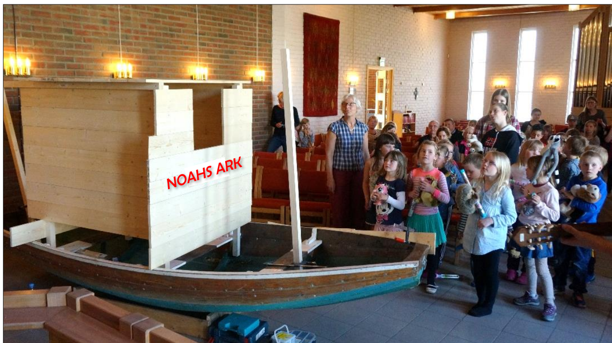
Bildene er hentet fra tidligere Noahs-Ark-dager i Berg og Strindheim kirke

Strinda kirke tirsdag 24. april 2018 kl 15.00 - 19.30