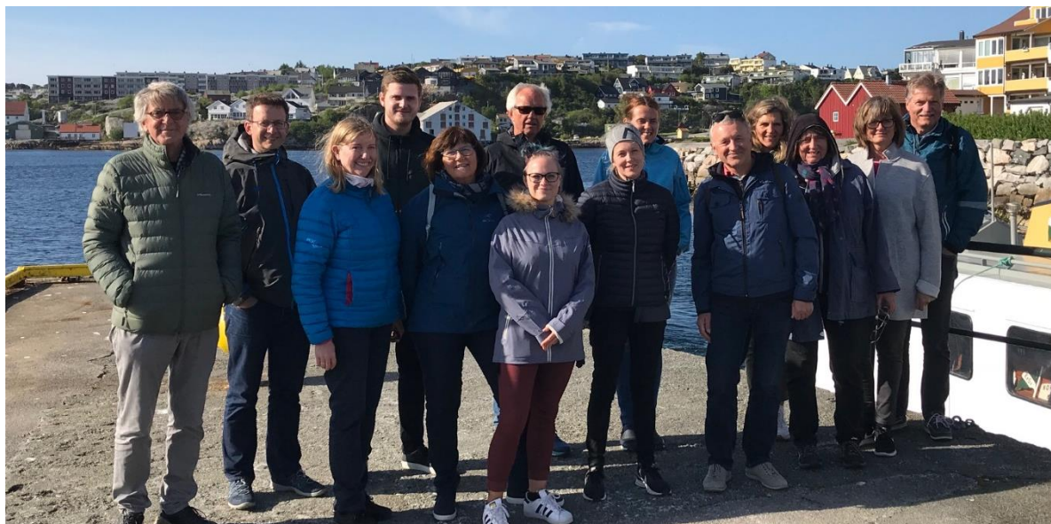
Stab og menighetsråd på tur i Kristiansund.