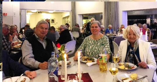
Medarbeiderfest i november