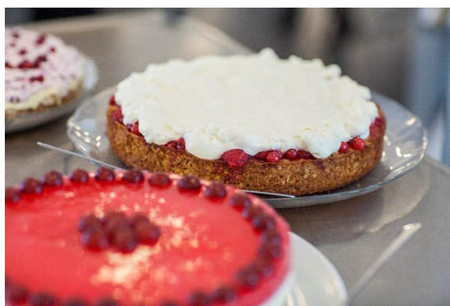
Snitter og deilig kaker på Formiddagstreff