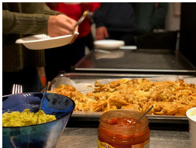
Nachos på KryBBa