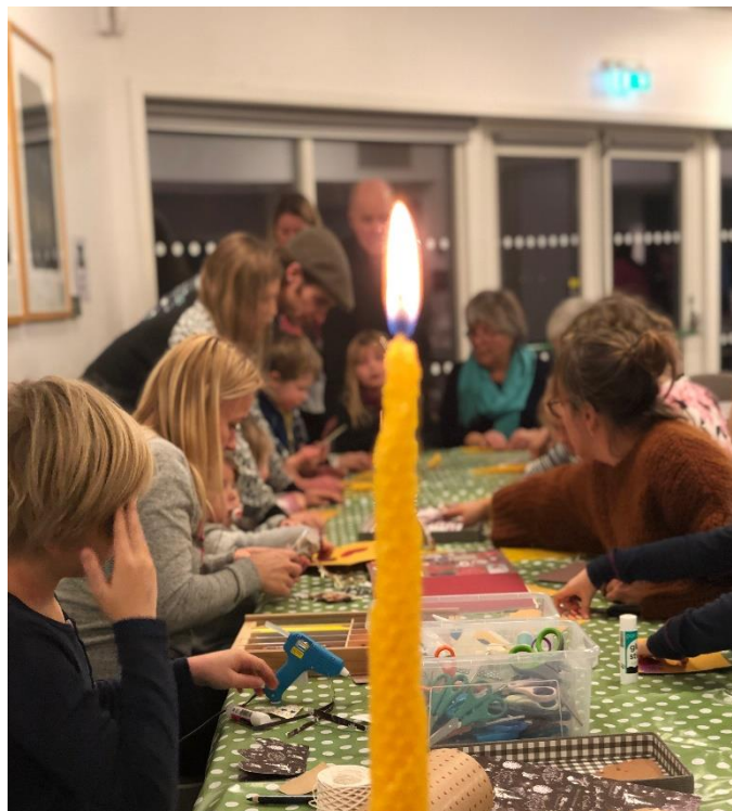
Juleverksted på Kirketorsdag i desember.

Det er bred enighet om at Sverresborg kirkesenter, slik det nå står, svarer til disse forventningene. Kirkesenteret kom raskt i bruk med allsidige aktiviteter.