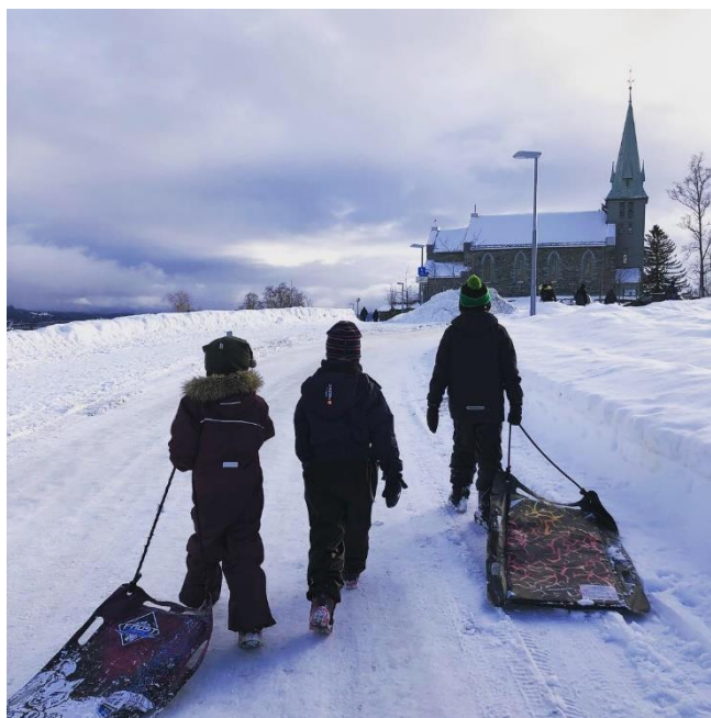
På veg til kirke

Noahs Ark (7-åringene) har blitt en tradisjon på en av skolens planleggingsdager i august, og vi er fornøyde med dette samarbeidet med Byåsen og Ilen menigheter.