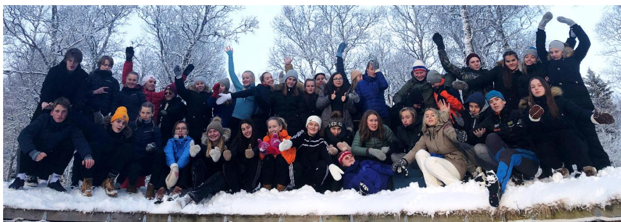
45 flotte ungdommer fra Byåsen, Sverresborg og Ilen på lederkurs!

Ungdomsledere: I 2018 var 32 ungdomsledere fra Ilen og Sverresborg med som ledere på konfirmantleir. Det er samlinger både i forkant og etterkant av leir, samt et julebord for lederne.