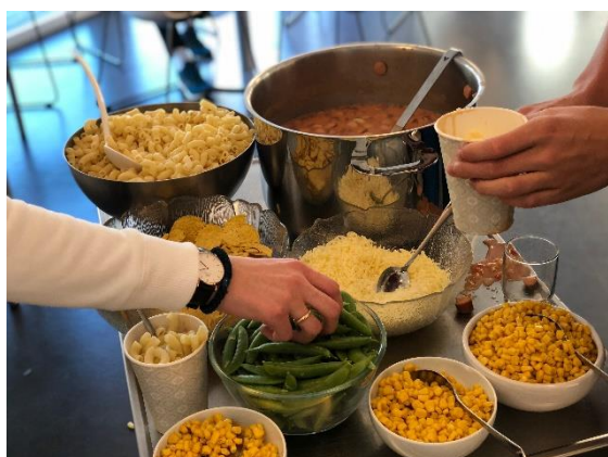
Tomatsuppe på Ungdomslederkurs