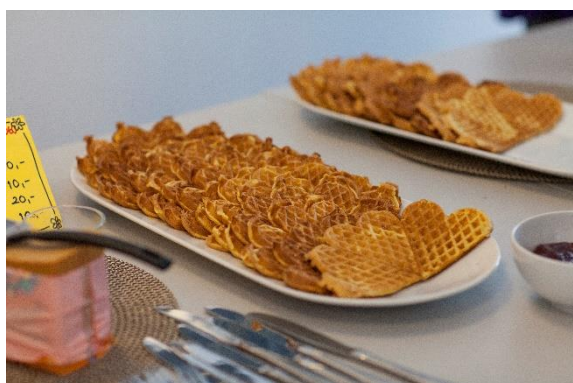
Vafler på mandagskafe

Vi samles ofte til måltid i menigheten, og for næring for både kropp og sjel. En uke i oktober 2018 ble det servert: