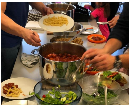
Kjøttboller og pasta på Kirketorsdag