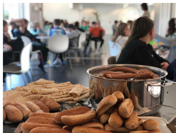
Pølser på Tweens