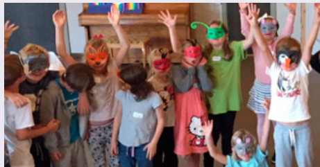
Med dyremaskene på trammer, sniker og danser barna inn til Noahs ark.

for alle som begynner i 2. trinn! Vi møtes i Byåsen kirke 13. august , og der skal vi snekre, lage dyremasker, spise, synge og spille. Vi hører historien om Noah og arken og regnbuen, og på slutten av dagen får familie og venner komme og se noe av det vi har gjort denne dagen. Dette er et samarbeid mellom Sverresborg, Ilen og Byåsen menigheter, og mange barn har vært med og hatt det gøy på dette tidligere. Invitasjon kommer i posten når det nærmer seg.