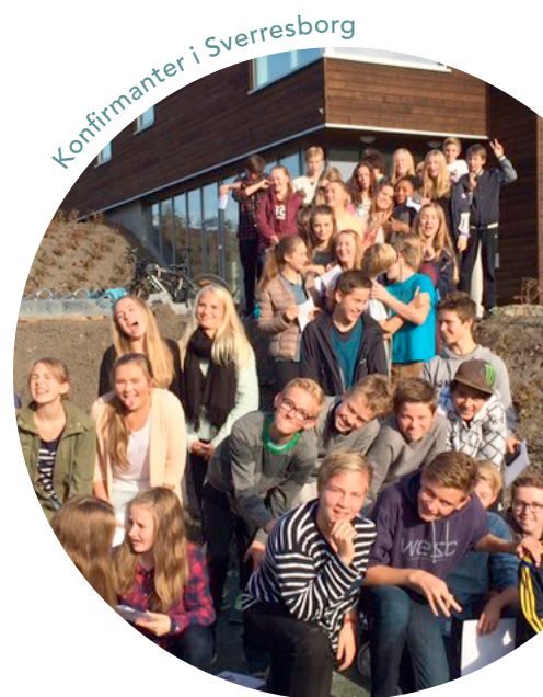
Konfirmanter i Sverresborg