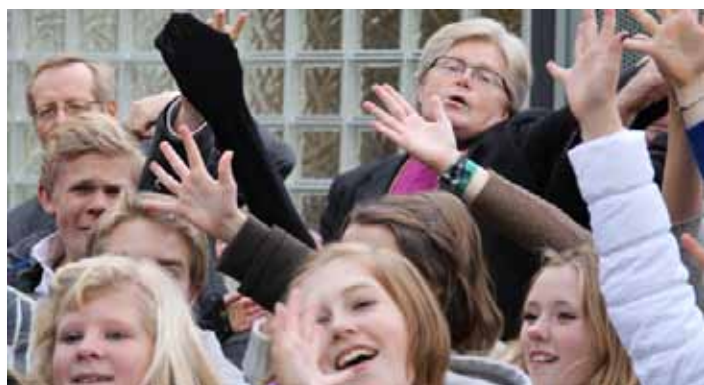
Flerstemt salmesang kan gi sangglede til flere enn biskopene og Oslo Soul Children.

I motsetning til den nåværende salmeboka, som foreligger i en bokmålsutgave (rød) og en nynorskutgave (grønn), er den nye felles for begge målformer.