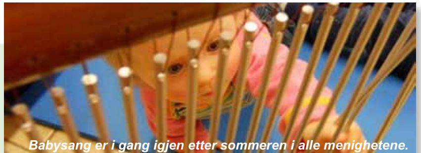
Babysang er i gang igjen etter sommeren i alle menighetene.