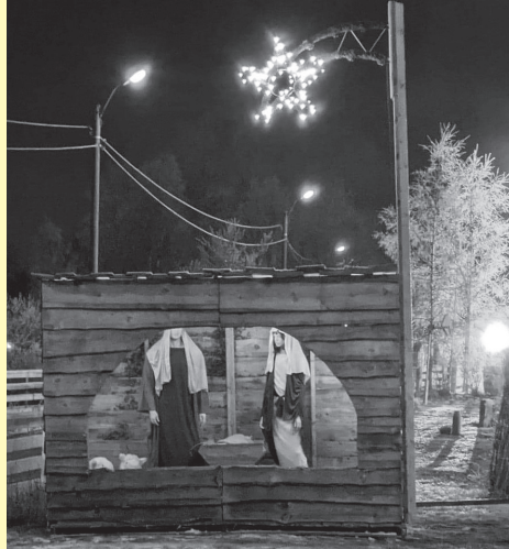
Julekrybben ved Østby kirke, som ble tent etter lysmessen den 29/11.