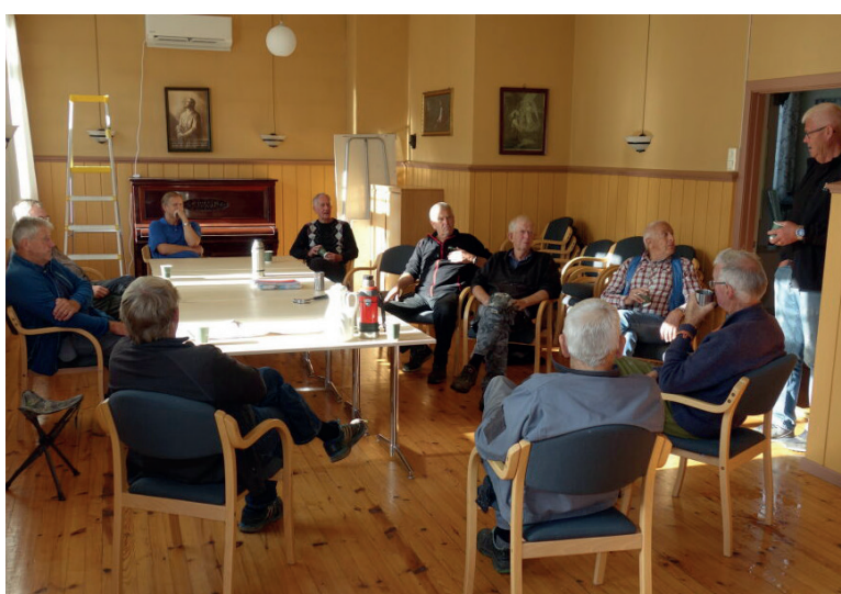
Dugnaden er godt i gang og humøret på topp!