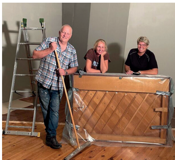
Kaffe og peptalk - i omgivelser mange husker

Programmet for 1. halvår begynner å ta form. Mye av samlingene står menigheten og Normisjon sammen om. Vi gleder oss, og vi håper at vi sees!