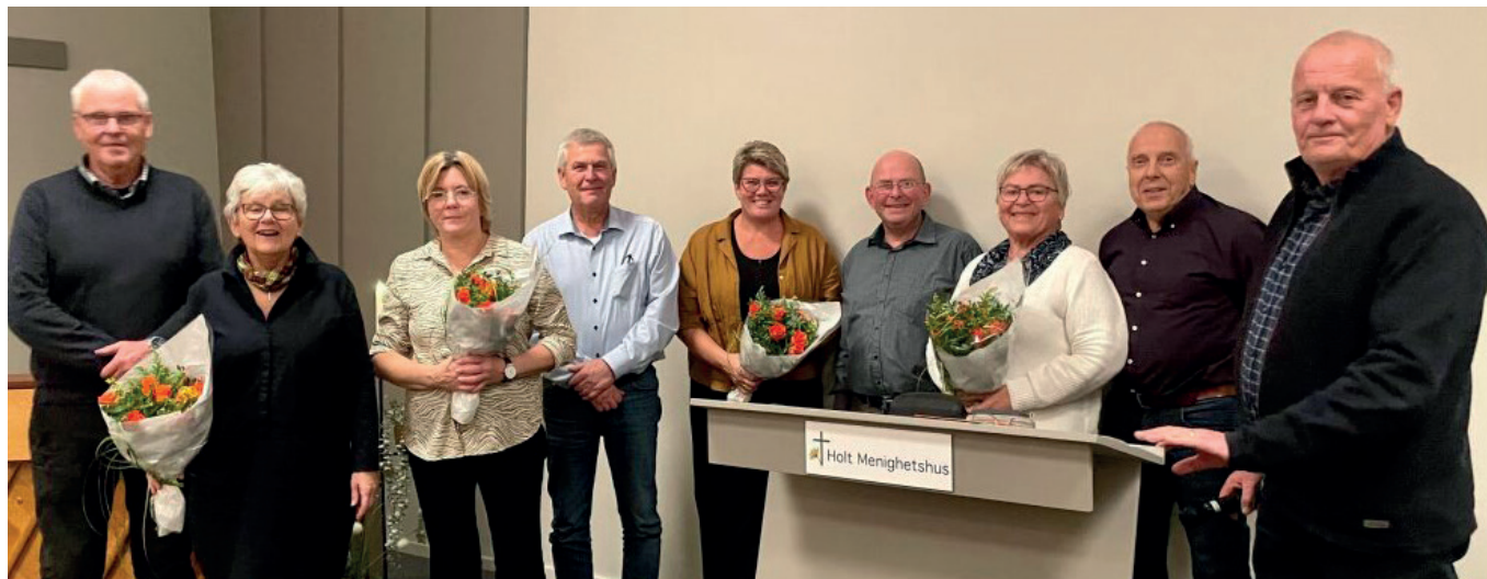
Første fest i et nyoppusset Menighetshus. De som hadde planlagt og ledet arbeidet fikk en svært velfortjent blomsterhilsen.

Vi holdt tidsplanen på to måneder, og vi trur at vi holder oss innenfor budsjettet også. 500 000 kr var kostnadsrammen. Med dugnad på rundt 800 timer av 30 og 40 personer, og gode rabatter fra så godt som alle leverandører, regner vi med at vi har investert 1 million i Holt Menighetshus.