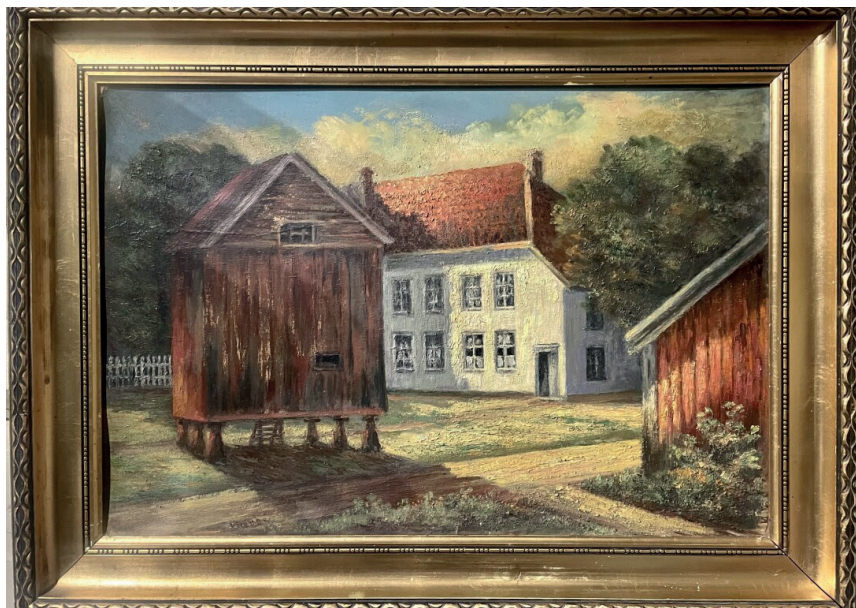
Dette maleriet fikk Holt menighet i gave i høst.