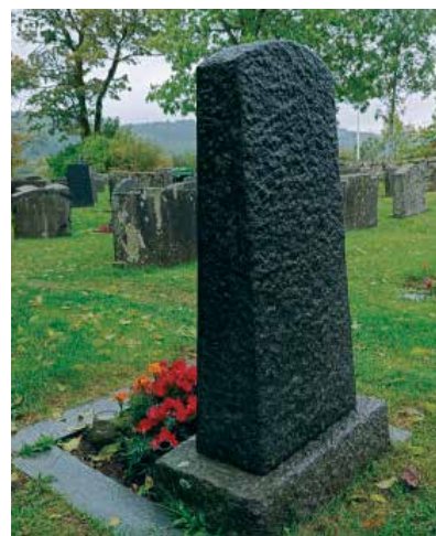
Under: Og slik ser baksiden av gravsteinen ut

Så da pappa døde i 2020, fant jeg fram steinen. Jeg tok den med til Fevik steinhoggeri, og fikk slipt og polert den, samt satt på nytt navn. Jeg synes det er blitt en flott stein, som passer godt inn på denne delen av kirkegården.