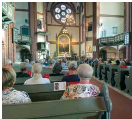
Trefoldighetskirken var reises slutt.