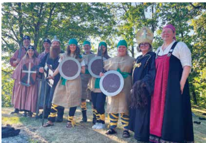
Slaget ved Stiklestad som for anledningen stod ved Kuben museum i Arendal.

Det var en sliten, men stolt og fornøyd gjeng som haltet og hinket seg ut av trefoldighetskirken og ut i det yrende folkelivet under Canal Street. De gode opplevelsene, samtalene, ordene og sangene tok vi med oss i hverdagen. I dagene og ukene etterpå pleiet jeg riktignok såre føtter og ben, men det ble overskygget fullstendig av den takknemligheten jeg kjente på. Jeg vil få lov til å berømme og takke alle de frivillige som på ulike måter bidro til at denne pilgrimsvandringen var gjennomførbær og ble så vellykket som den gjorde – og jeg vil få lov til å takke mine medpilgrim�er. Det er fint å ha fine følgesvenner på ferden, en varm søskenflokk som sammen søker til Gud og det hellige.