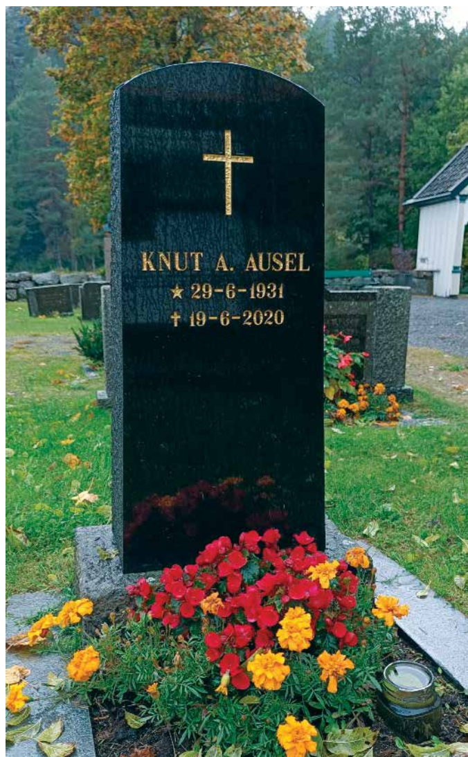
Over: Flott eksempel på gjenbruk av gammel gravstein på Holt kirkegård.

Som nevnt jobbet jeg tidligere på kirkegårdene i kommunen. For ca 35 år siden fikk jeg beskjed om å fjerne en stein som skulle destrueres. Det var en stein i sort granitt, ikke så stor, men veldig fin form på. Denne steinen ønsket jeg å ta vare på. En eller annen gang trenger man jo en