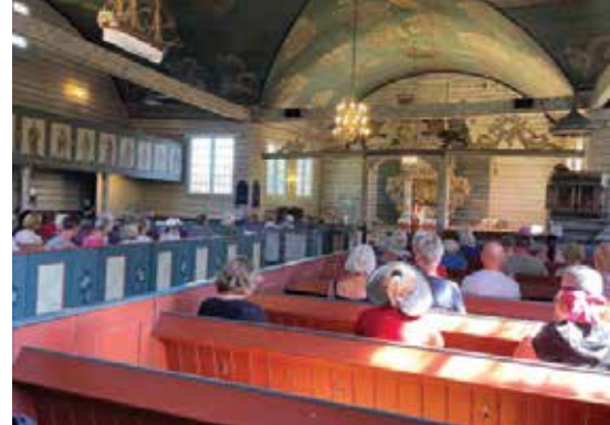
Pilgrimene ankommer Austre Moland kirke hvor det ble holdt middagsbønn.