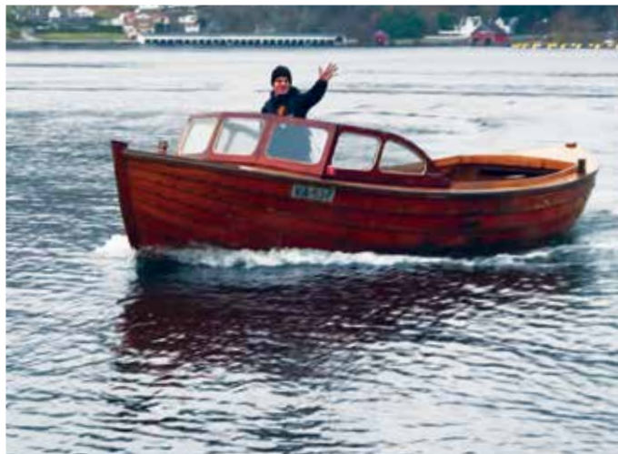
Ekte tresjekte må til! Earling kjøpte den av en fisker.

Som en viktig del av sitt profesjonelle virke driver