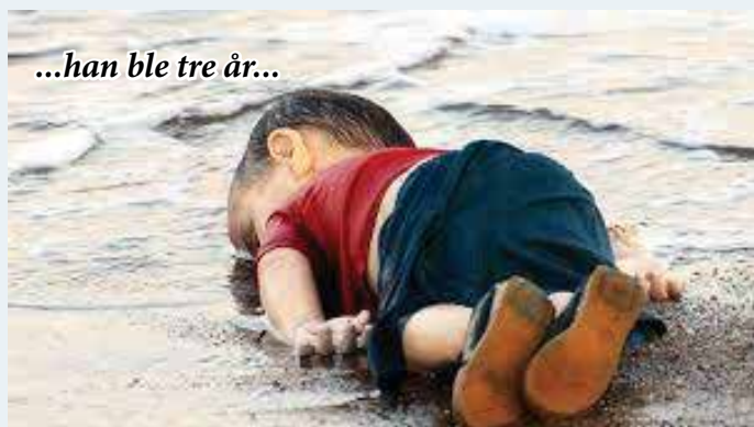
...han ble tre år...

og EØS-borgere uten europeisk helsetrygdkort må selv betale for hjelpen. Det kan bli dyrt.