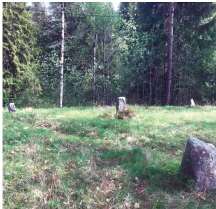
Gravsteinene fra førkristen tid (200-300 e.kr) er en trekantgrav med helleliknende stein i midten.

Den bygda i østre Agder som har flest oldtidfunn er nok Fjære i Grimstad. Den var dominerende i oldtiden og lå nær kysten. Den var tettbygd i oldtid og gav muligheter for både sjøfart og jordbruk. Holt gav også muligheter i oldtiden. Gårdene vokste seg seint fram. Eldste gutten dreiv odelsjorda og de andre dro ut på handelsferd og vikingtokt. Kanskje dro odelsgutten med ut også noen ganger? Det hadde vært interessant med kart og fortegnelse over dette i dag! Sjøen lå høyere da enn i dag og man kunne øst i