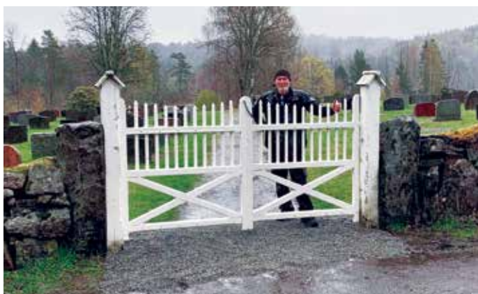
Under: Port på Holt kirkegård

Holt kirke er kommet i gang igjen og vil fortsette utover sommer og høst. Det er mye som skal gjøres dette året. Arbeidet utføres av svært dyktige håndverkere fra Bøylestad Moen AS, i tråd med kravene fra Riksantikvaren for fredede bygg.