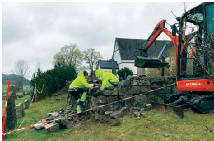
Over: «Prestebegravelsen» på Holt kirkegård