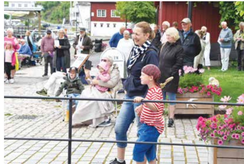
Mange små og store «pirater» fylte brygga.