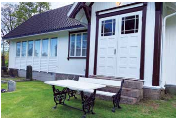
Nye benker ved Tvedestrand kirkegård

Tusen takk til alle som bidrar på ulik måte for kirkebygg, kapell og kirkegårder!