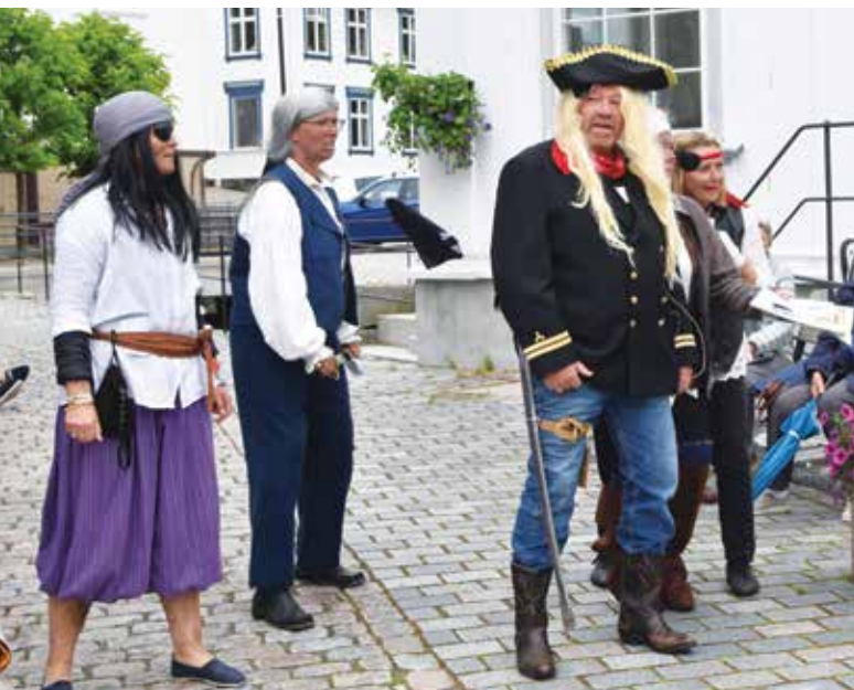
Kapein Krabbe Klo dukker opp med sine menn...

to tusen år senere kan vi fortsatt glede oss over at vi har det slik. For sin del var Jesus flink til å inkludere mennesker som var rammet av utenforskap. Vi skal følge hans eksempel og slippe inn mennesker som