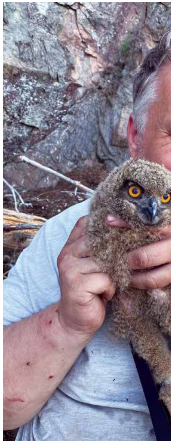
Sven Inge Marcussen med en hubrounge som

- Fauleforeninga ble starta i Holt for 50 år siden. Boka er historier om faul og faulefolk i Aust-Agder, fra midten av 1800-tallet og fram til i dag.