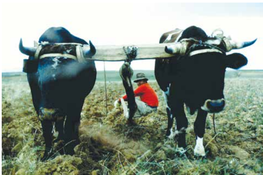
Okser i arbeid.

De seksti minuttene intervjuet varer, forløper fort. Ved ettertanke erkjenner jeg et ønske om å snakke mer med denne mannen.