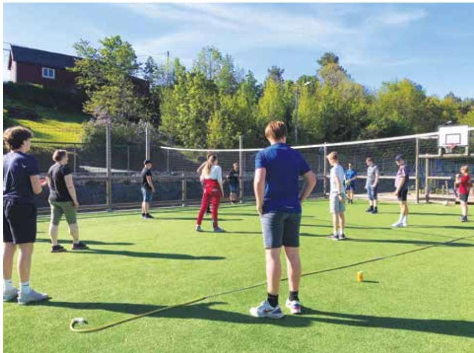
Volley: Kvelden begynte med ballspill og lek i strålende solskinn.

Utover kvelden trakk vi inn i «Kjelleren» på Songe frikirke. Der