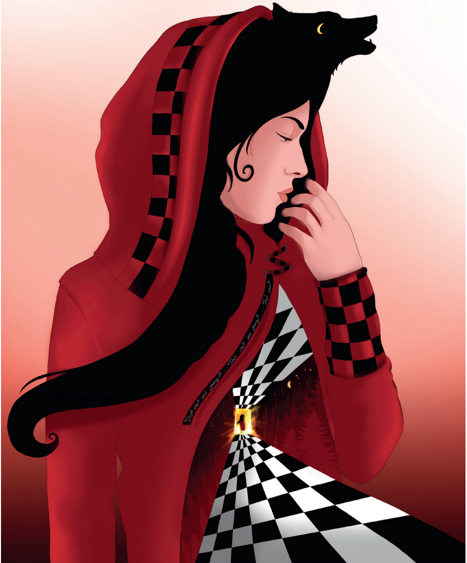
Fra Johan Reising's maleri Rodhette