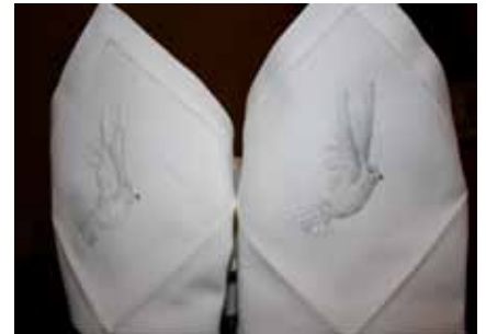
Den håndbroderte dåpskluten gis som gave til barnet fra Ullensaker menighet.

Kundekretsen til bedriften kommer fra både inn- og utland. Mange av hennes duker og gardiner har funnet veien til norske hjem. I vareutvalget er også håndbroderte putevar, annet sengetøy, klær,