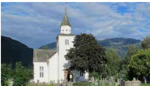
Ulvik kyrkje ein sommardag.

Kyrkja har stått som eit smykke midt på Brakanes sidan 1858. Ho er ein samlingsplass i glede og sorg, og eit visuelt midtpunkt i bygda. Med jamne mellomrom treng ein slik stor trebygning vedlikehald, og alle ser nok at det er sårt tiltrengt no. Denne våren vil kyrkja verta vaska. Det hjelper på førsteintrykket, men det trengs meir for å ta vare på bygningen.