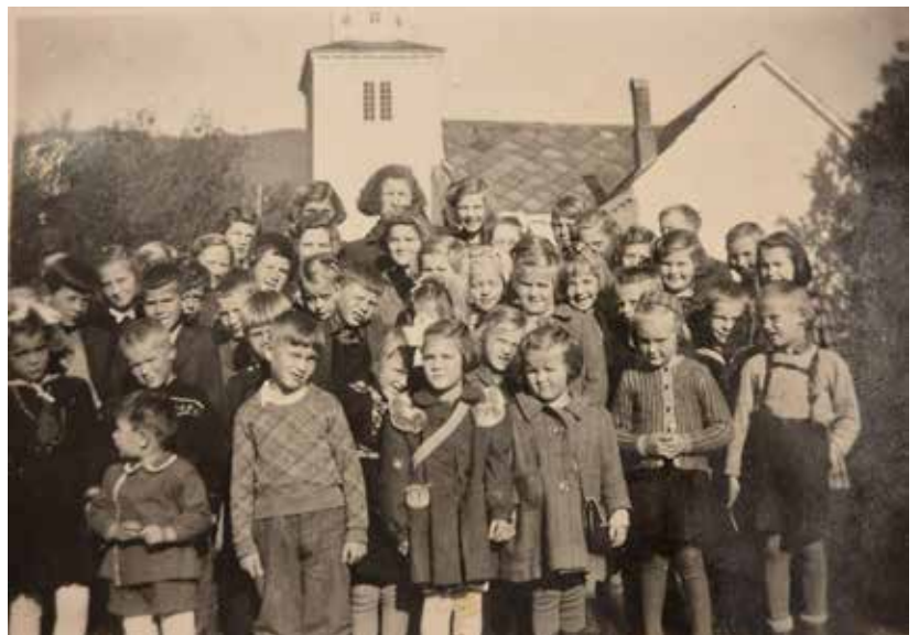
Braknes søndagsskule ein dag under krigen.