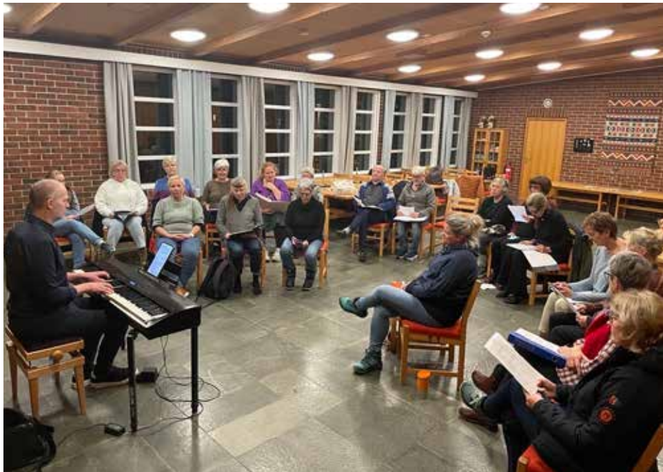
Toneskredo har korøving i Eidfjord kyrkje annankvar måndag.

Velkommen til oss i Toneskredo, og velkommen til basar på samfunnshuset 1. april.