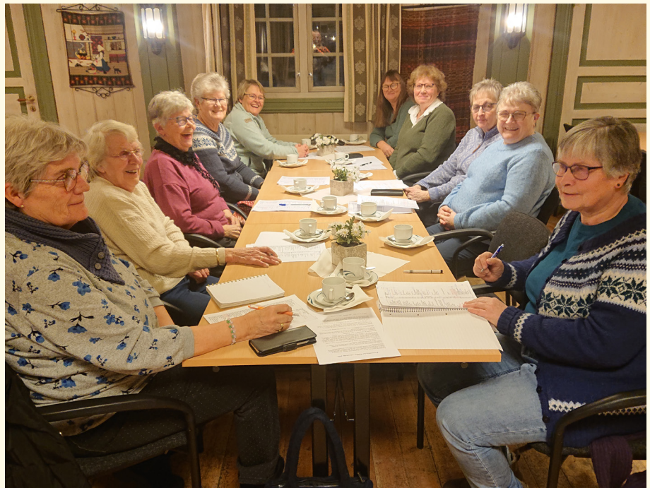
Fra Kirkens Julemesse sitt årsmøte som ble avholdt i Stallen.