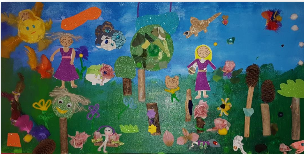
Sommerekunst av klasse 3b ved Vadsø barneskole.

Dette nyhetsbrevet vil handle om hvor og når det er gudstjenester i sommer og litt om aktiviteter vi har hatt og planlegger å ha. Det blir litt nytt fra misjonsprosjektet og vår diakon skal fortelle om sitt arbeid.