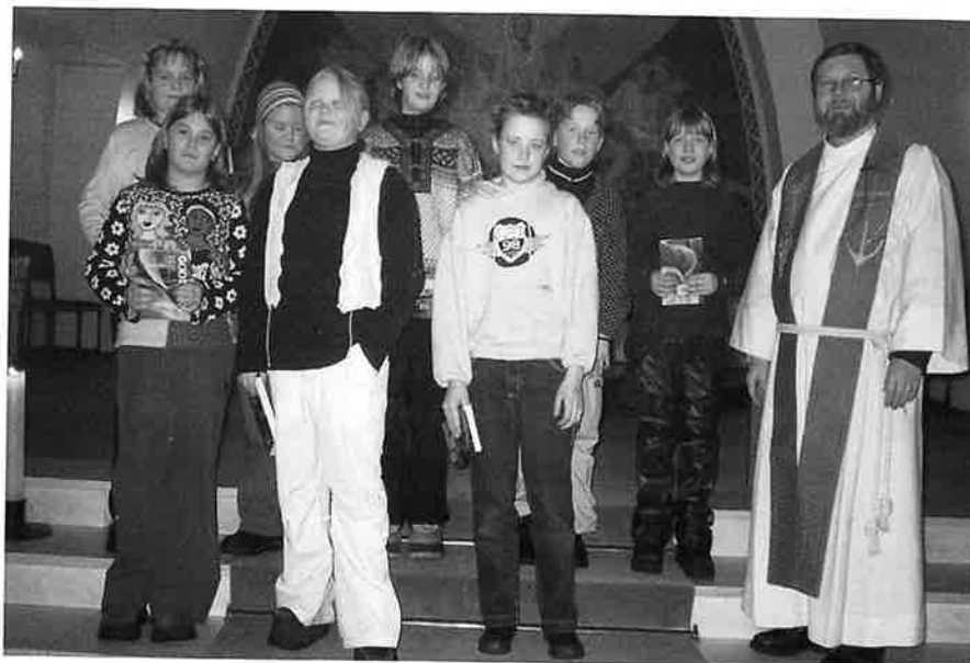
5. klasse ved Stanghelle skule