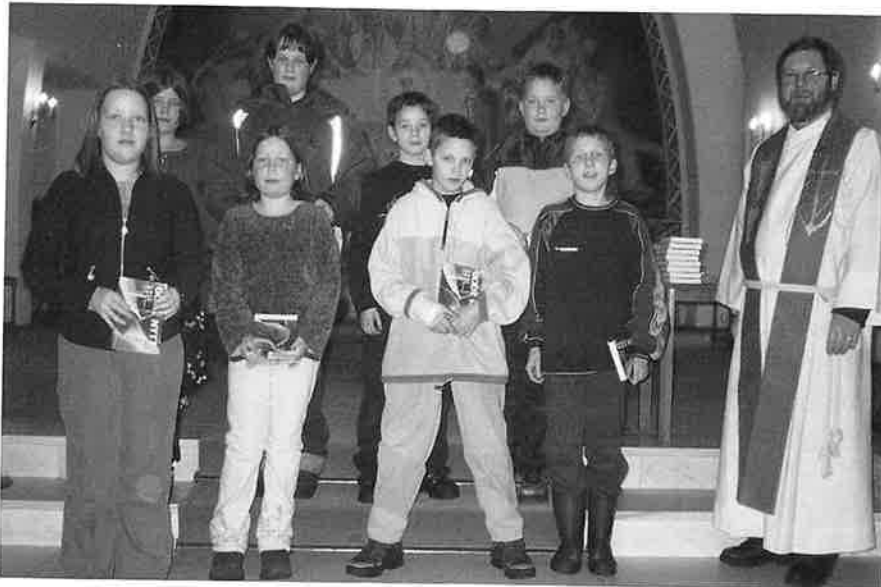
5. Klasse ved Dale skule