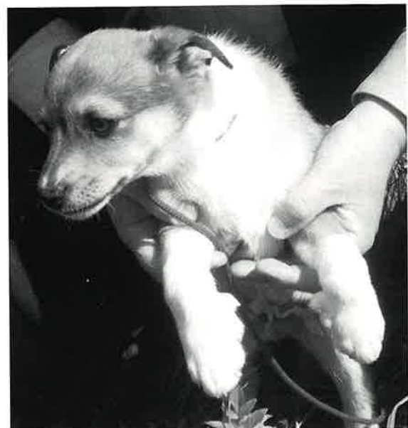
Benoni, Lundehundkvalp, Vaksdalsgarden 10, klar til å utforske verda.

Boka kan tingast frå Kyrkjekontoret, Boks 113, 5721 Dalekvam . Tlf. 56 59 39 20