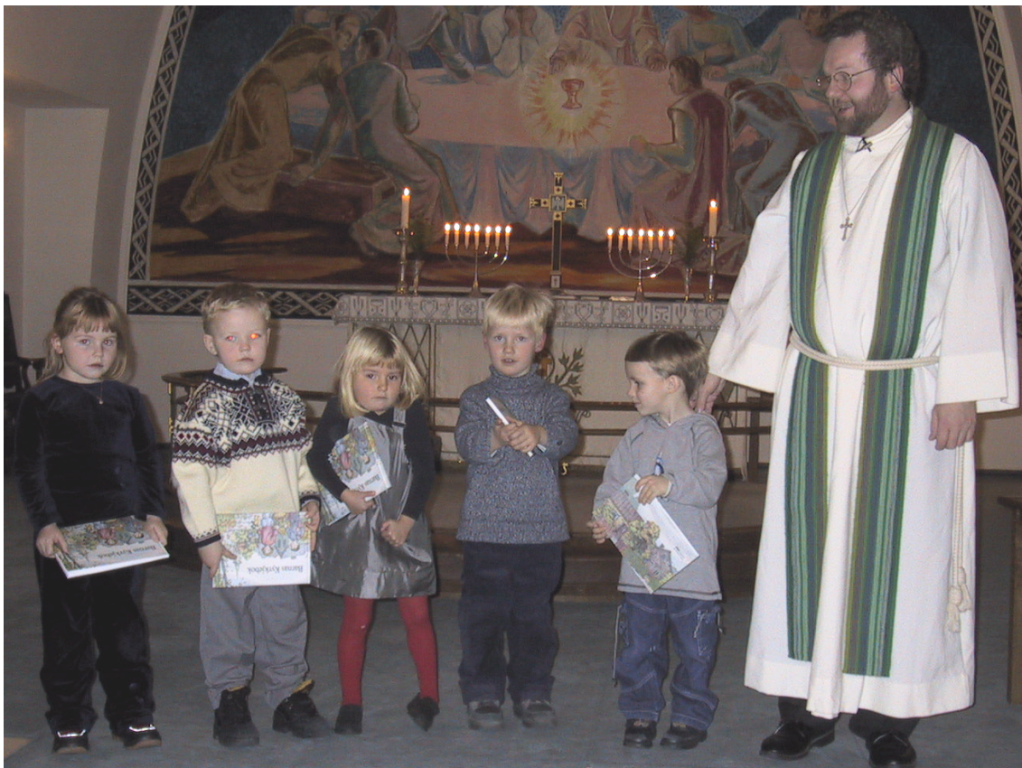
4-ÅRINGAR FRÅ STANGHELLE