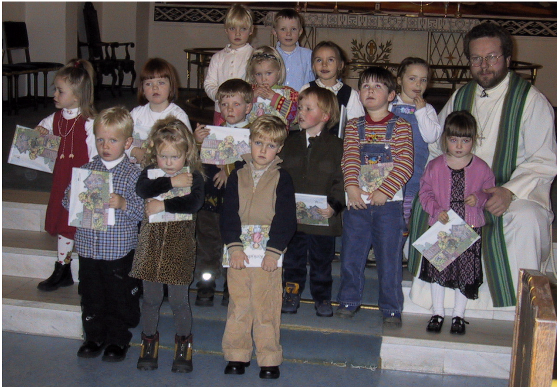
4-ÅRINGAR FRÅ DALE