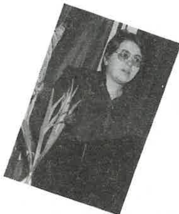
TALAR OG HELSINGAR