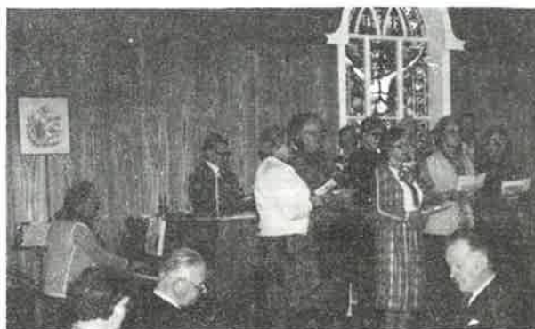
VAKSDAL KYRKJEKOR SYNG