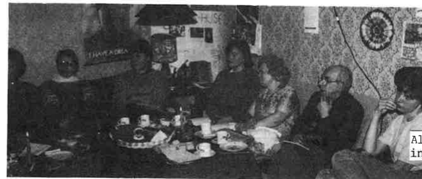
Alle kan hjelpa nokon, ingen kan hjelpa alle.