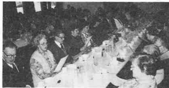
Eit glimt frå eit festpynta og fullsett Stanghelle bedehus

- Og vi treng vel ikkje vente på å få endå to nye prestar før vi prøver att?