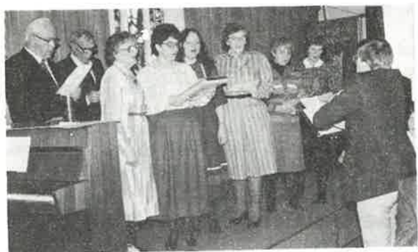
DALE KYRKJEKOR SYNG