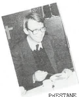
PRESTANE ET ERTERSUPPE