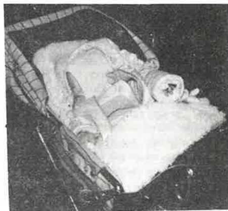
JON VILLY SØV