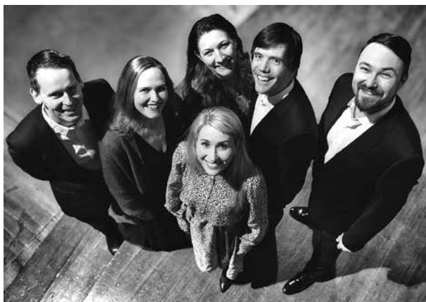
TABULA RAS: Tabula Rasa held konsert på Dale.