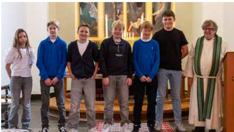
KONFIRMANTAR: Konfirmantane på Vaksdal vart presenterte for kyrkjelyden 1. september.