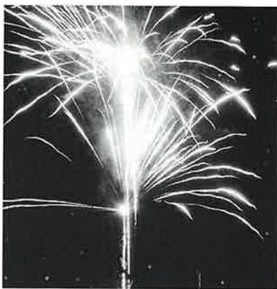
Mykje fint fyrverkeri nyårsafta.