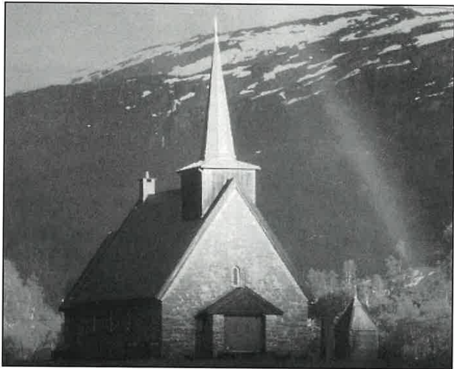
Bergsdalen kyrkje er ei av kyrkjene der "Godt Nytt" vert utdelt.

Giro er innlagt i bladet. Vonar flest mogeleg nyttar den.