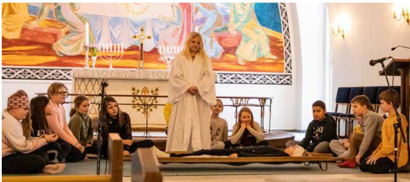
Den lame mannen: Dramatisering av forteljinga om den lame manne som venene bar til Jesus.

I slutten av januar inntok fleire av årets elleveåringar Dale kyrkje, og overnatta der. Dei var nok spente då dei kom til kyrkja, for fyrste gong med sovepose! Men opplegget fenga, og det vart eit kjekt lite døger i kyrkja. Dei var gjennom ulike aktivitetar, blant anna lagning av Kristuskrans (armband), og førebuing til gudsteneste. Og så fekk dei god mat sjølvstilt! Under gudstenesta søndag var dei fleste borna involverte på ulikt vis, og dei verka til og med lys vakne, trass sikkert litt mindre søvn enn vanleg!