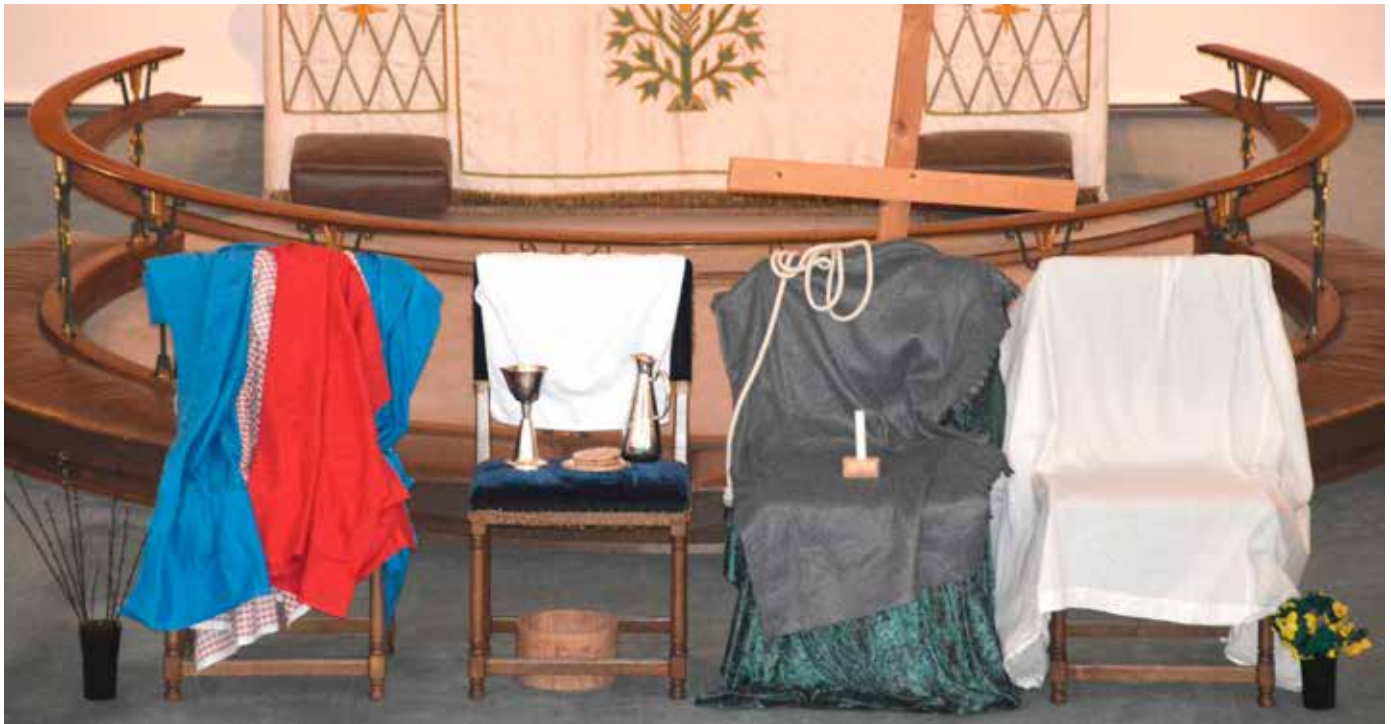
Fire stolar: Bilete syner fire stolar som står framme i Dale kyrkje. Dei vart sett opp slik under Borna sin påskedag for to år sidan. Stolane og det som står rundt dei symboliserer kvar sin dag i påska. - Greier du å sjå alle symbola og kva dei kan fortelje deg?