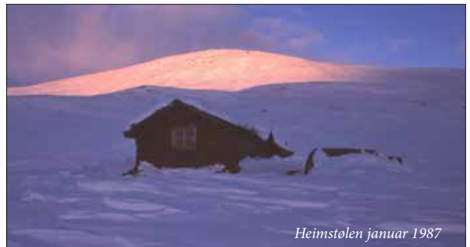
Heimstølen januar 1987

Selet var berre eitt rom, men alle hadde vi liggeplass. Mor og far i senga, og vi ungane på ein benk og på madrass på golvet. Det var også fast skikk å ha gjestebod medan vi var på heimstølen, det var utruleg kor mange som kunne få plass inne i det vesle rommet. Vi var også i gjestebod hjå dei næraste stølsgrannane og på andre heimstølar. Dette var kosestunder vi såg fram til.