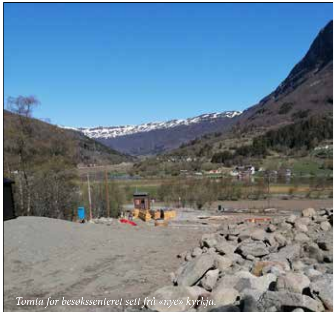
Tomta for besøkssenteret sett frå «nye» kyrkja.