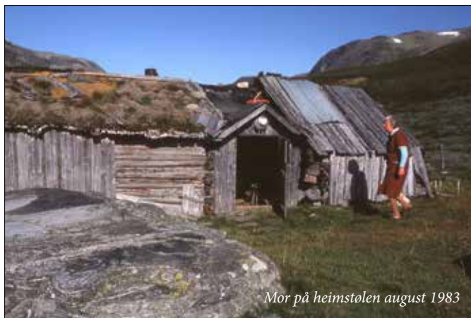
Mor på heimstølen august 1983