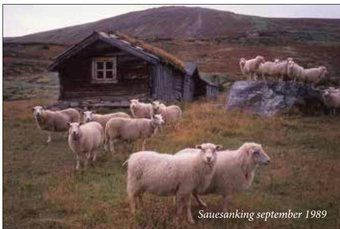
Sauesanking september 1989