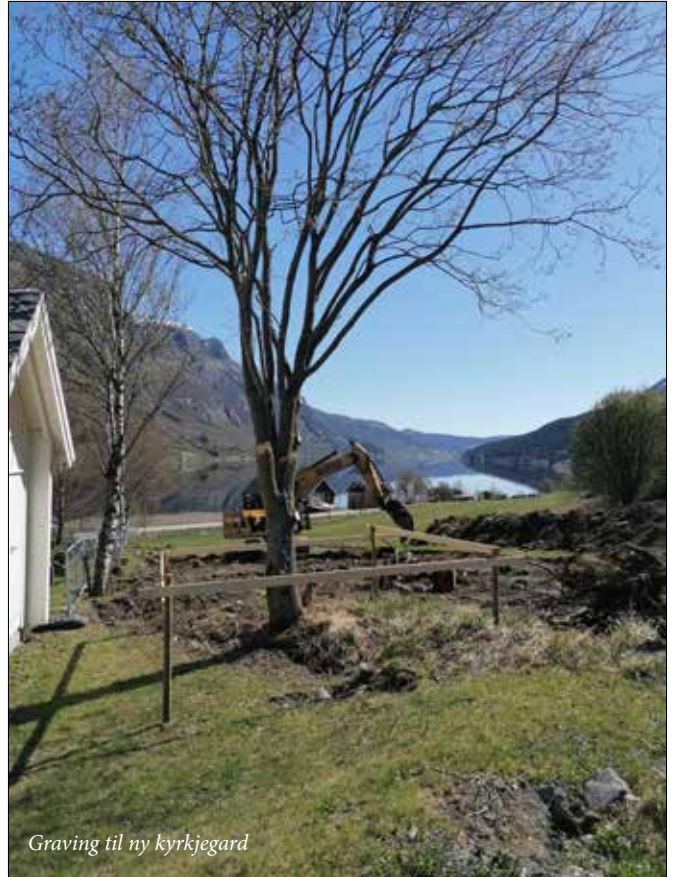
Graving til ny kyrkjegard