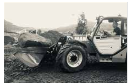
Nicolai Wangensteen med Makken-hansker. Rune Wangensteen i sving med grunnarbeid.