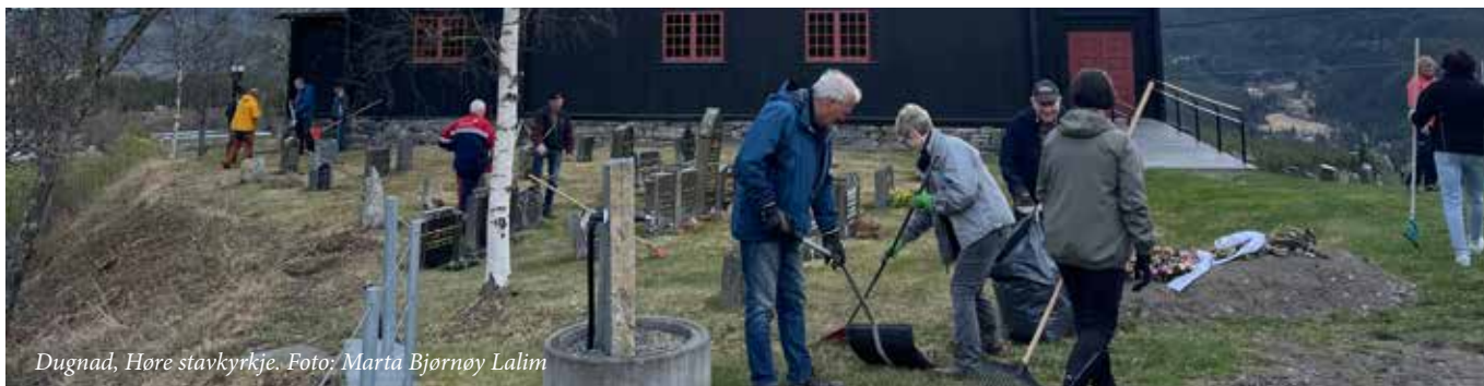
Dugnad, Høre stavkyrkje.