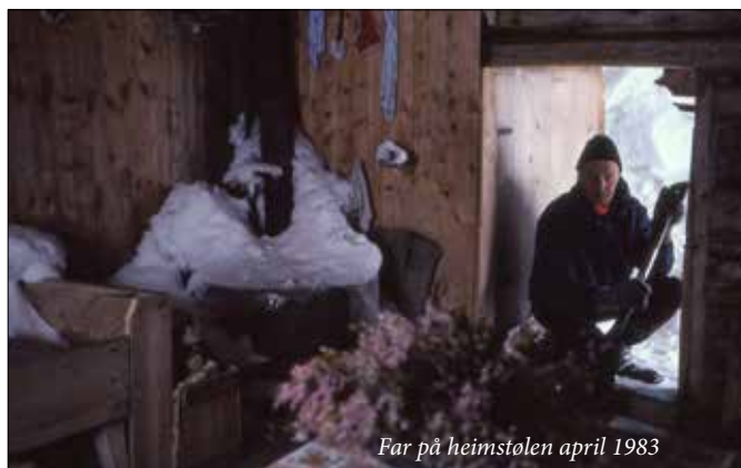
Far på heimstølen april 1983