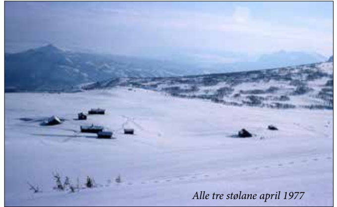
Alle tre stølane april 1977

parafinlampe inne i selet. Difor var det ingen stad stjernehimlen og måneskinet var klarare enn her, men det var også stupmørkt i overskyta vèr. Sjølv om stølen ligg berre tre