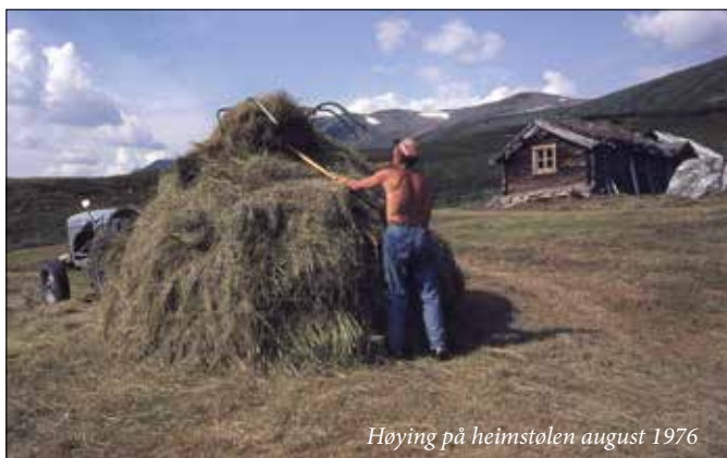
Høyning på heimstølen august 1976