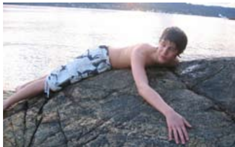
Det var ikke veldig varmt på Lunde i starten på juni..