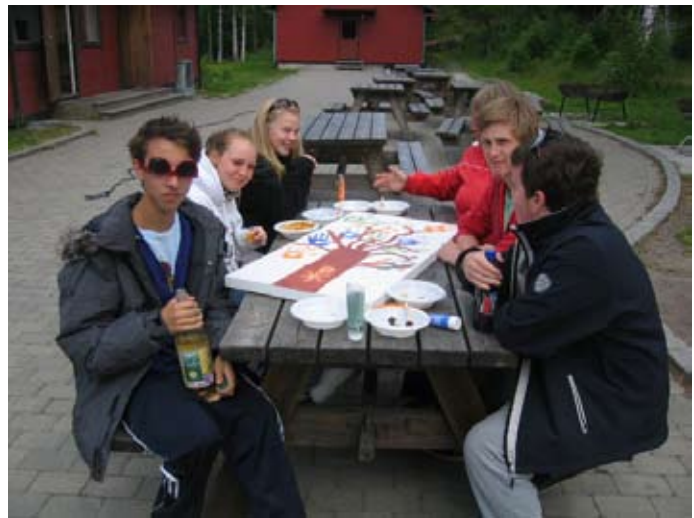
MILKere utviser kunstneriske ferdigheter