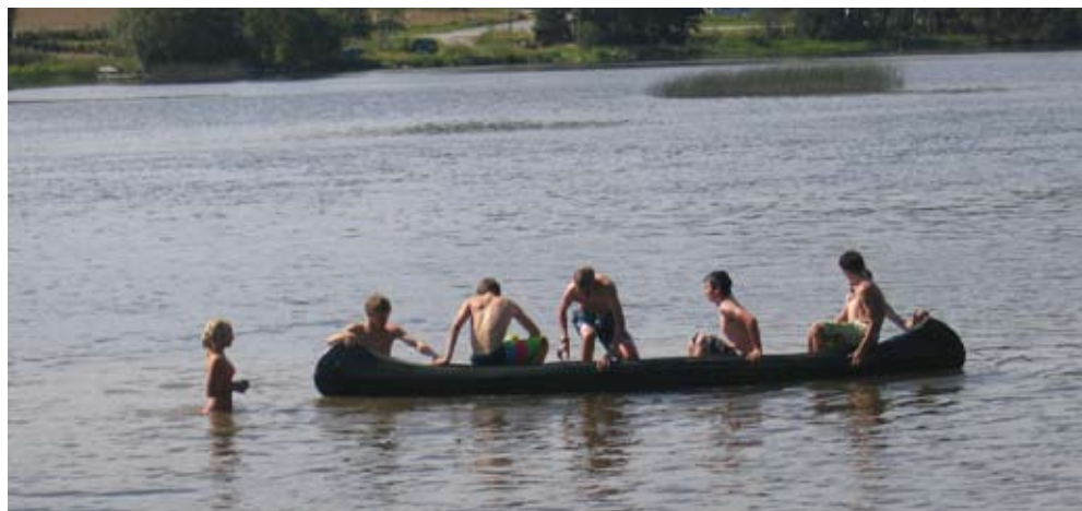
Friluftsgruppa fikk naturopplevelser både til lands og til vanns