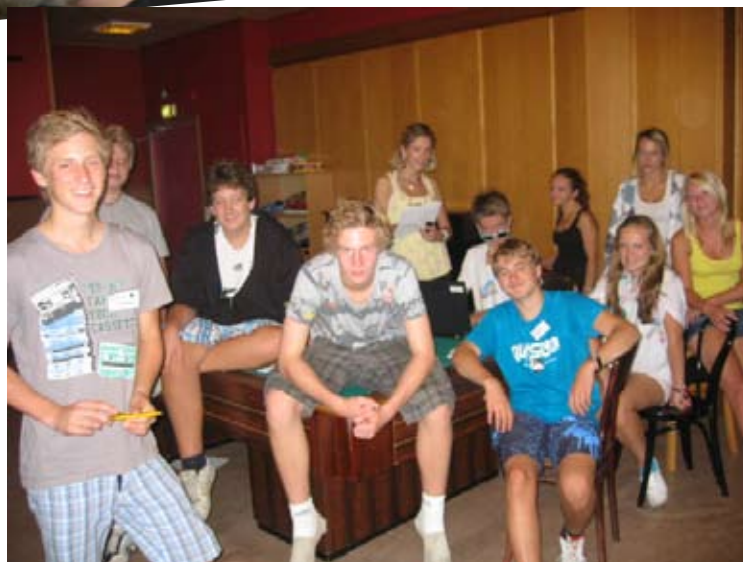
Leiravisgjengen pønsker ut nye vinklinger på stoffet..