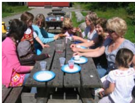
Godt fellesskap for små og store på menighetsdagen. Venter de på vafler, mon tro?