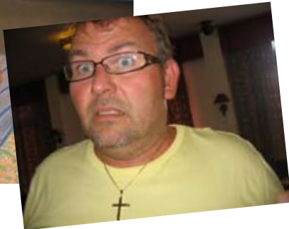
Her viser ledernes ansiktsuttrykk tydelig at konfirmantleir er for tøffinger!