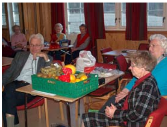
Lykkelige vinnere etter loddtrekning på julemesse for noen år siden.

Tidligere år har det også vært barnehage i underetasjen, søndagsskolevirksomhet (både oppe og nede), moderne danseundervisning, barne- og ungdomsklubb og konfirmasjonsundervisning.