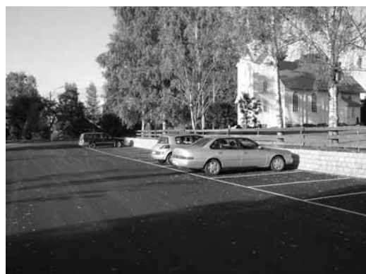
Den nye kirkegårdsmuren og den nyasfalterte parkeringsplassen.