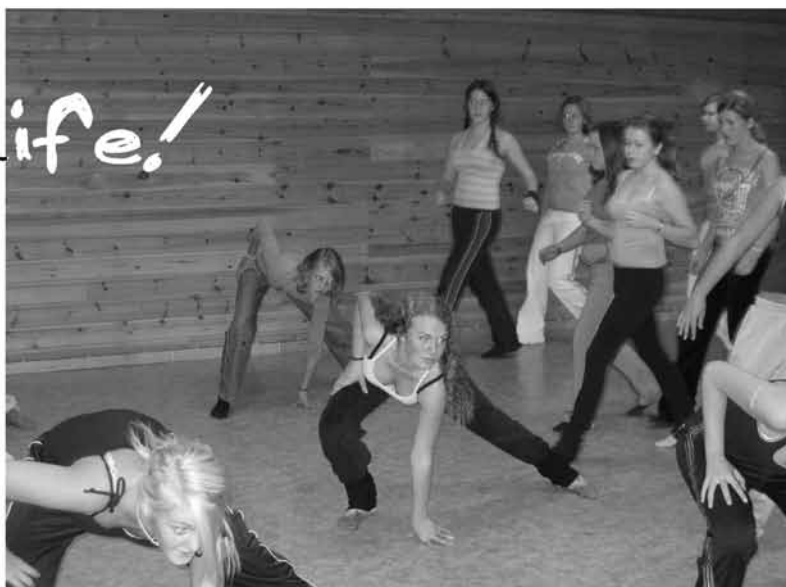
Dansegruppen i aksjon!

hadde koret øvelse – som regel pleier de å øve oppe i menighetssalen, men i dag var det opptatt der. Barne- og