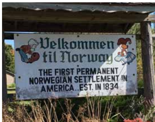
Fra det lille tettstedet Norway sørvest for Chicago

de bygde kirker der de kunne synge de gamle salmene og der Guds ord kunne forkynnes på deres eget språk.