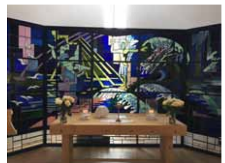
Altertavlen fra SS Norway

20. november 2011 kunne endelig Sjømannskirken – Kronprinsesse Mette-Marits kirke – Scandinavian