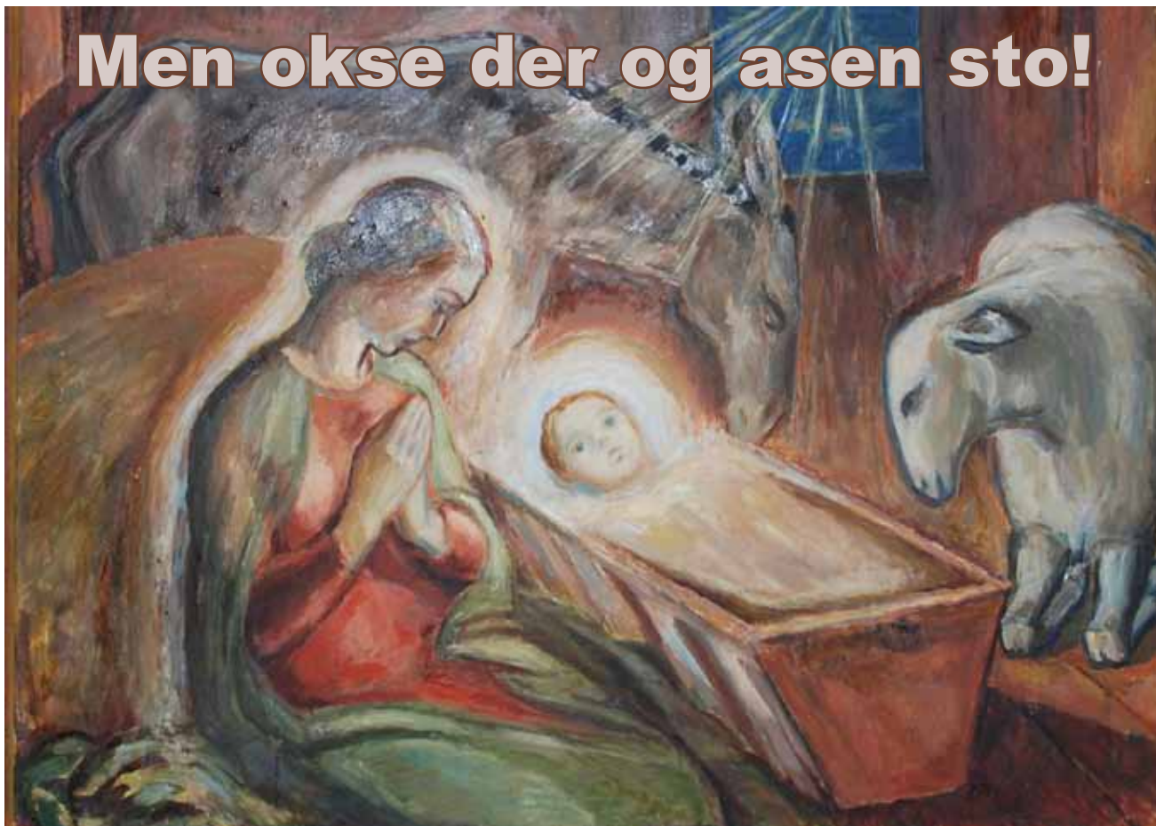
Julenatt - Altertavle i Tistedal kirke i Halden.

Frans av Assisi levde i det praktfulle landskapet i Assisi i Italia for syv hundre år siden. Han var en rik forretningsmann som i en kraftfull visjon foran et bilde av den korsfestede Kristus ble kalt til å selge alt han eide og vie sitt liv til å fornye kirken og vandre med fattige og utstøtte. Hans usedvanlige følsomhet ga ham et særlig nært forhold til alt levende. Han levde et liv i fattigdom, bønn, faste og selvutslettende omsorg for syke og utstøtte.