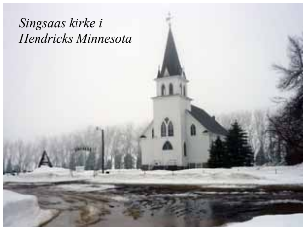
Singsaas kirke i Hendricks Minnesota

Da vi kom til Miami falt jeg pladask for de vakre Art Deco-bygningene på Miami Beach, og for å lære mer tok jeg et par guide-kurs, og plutselig var jeg Miami-guide. Tilfeldigheter førte til at jeg fikk være med som assistent på en busstur med norske turister i Midtvesten, og plutselig var jeg reiseleder og guide for norske grupper på tur i USA. Et lykketreff for meg som liker å være sammen med folk, som elsker å reise og er blitt opptatt av det meste som skjer i USA. Disse turene har tatt meg over store deler av USA, til store byer, over prærien, over brede elver og høye fjell, det er et fantastisk land å reise i. Jeg elsker