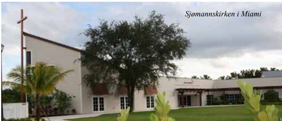
Sjømannskirken i Miami