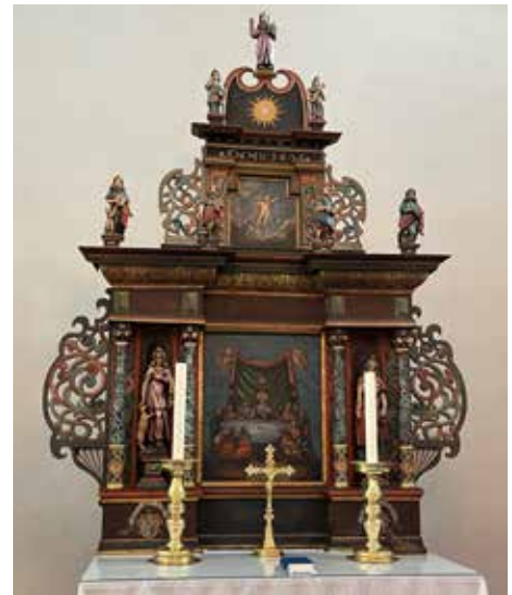
Altartavla i Ås kirke.

Neste gang du er innom en av kirkene våre er det verdt å la blikket vandre gjennom kirkerommet. Som kirker flest er det mye symbolikk å ta inn, og naturlig nok er påskehøytiden en symboltung høytid i kirkebyggene våre. Vi har tatt turen innom både Ås, Eina og Raufoss på jakt etter påskesymboler.