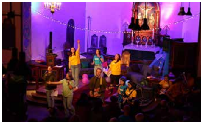
Bilde fra tidligere kveldsgudstjeneste med dans, lovsang og band.

Mange venter på å bli spurt direkte før de melder seg til frivillig arbeid i kirka, men det er ikke alltid like lett for oss ansatte å snappe opp hvem vi kan spørre. Vi tror det finnes mange i kirka vår med store ressurser og uante muligheter, som vi bare ikke vet om. Kanskje du ikke vet det selv engang? Kanskje du aldri har blitt spurt om du kan hjelpe til, og kanskje du ikke aner hva du skulle ha gjort? Kanskje du ikke har et stort nettverk der du bor, men du har allikevel tid og lyst og evne til å være en ressurs i kirka vår. Vi har lyst til å bli kjent med deg. Vi tror alle trenger et fellesskap, en gjeng. Og vi tror at å engasjere seg i frivillig arbeid, kan være en av de beste måtene å finne et sted å høre til.