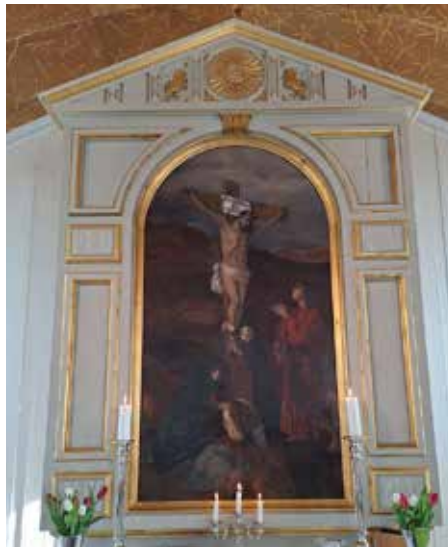
Altartavla i Eina kirke.