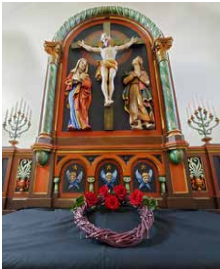
Altartavla i Raufoss kirke, med tornekrans og 5 roser på et alter dekket med svart duk på langfredag.