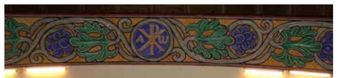
Korbuen i Raufoss kirke