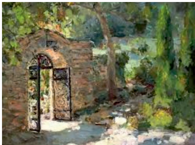
Lachezar Radov: Porten til Getsemane

Jesus et påskelammet saman med læresveinane sine. Han vaskar føtene deira og trøyster dei. Så drar dei til ein hage.