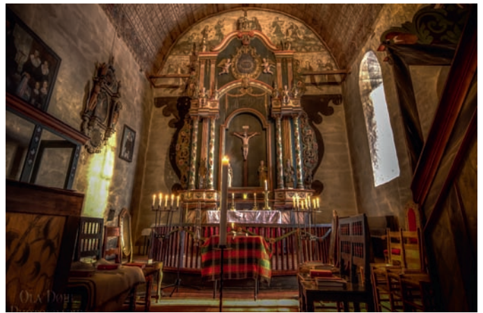
Slidredomen pynta til Vesper

Det kan vera ei stund for spesielt interesserte, dette, men dersom du lengtar etter ro og likar stemning, ja, då kan ein vakker halvtime som talar til fleire sansar, vera noko å prøve!