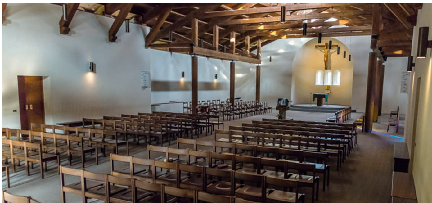
Den nye, vakre kirka.