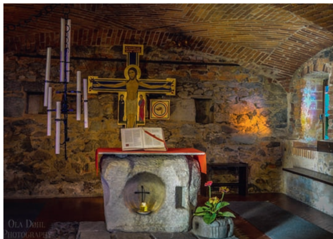
Det første kirkerommet, før nykirka ble bygd.

Et spesielt øyeblikk er det da han også tar noen av oss med ned i kjelleren av gjestehuset, hvor det henger hundrevis av ikoner i alle størrelser og som alle er malt til liturgisk bruk i Bose. Det kjennes nesten som om jeg er kommet til himmelen. Mange store kunstmuseer rundt omkring i Europa har jeg besøkt, men ingenting kan måle seg med dette, selv ikke det sixtinske kapell i Vatikanet.