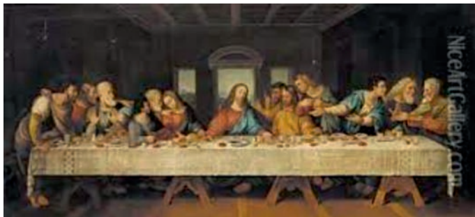
Leonardo da Vinci: Nattverden