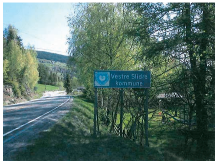
Kommunevåpenet for Vestre Slidre er eit middelaldersk våpenskjold som er avdekkja på nordveggen i Slidredomen.