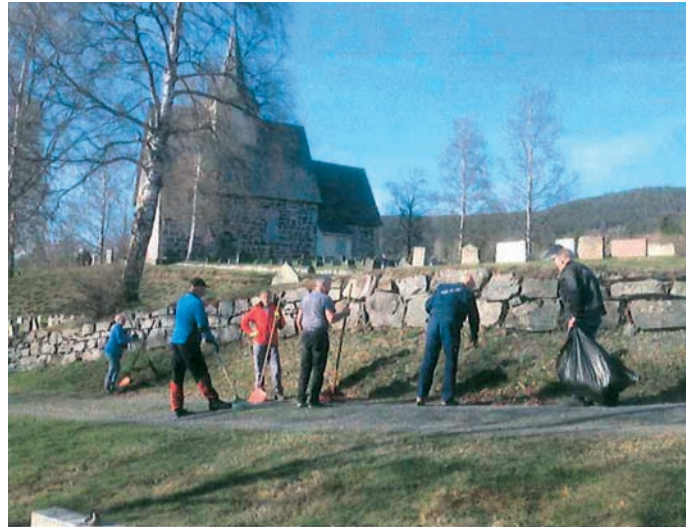
Dugnad på kyrkjegarden ved Slidredomen.

Vi har også vore med på den årlege Fasteaksjonen, og mange gudstenester – vi skal helst delta i 12 gudstenester, då er sjølve konfirmasjonsmessa med også, og så skal vi