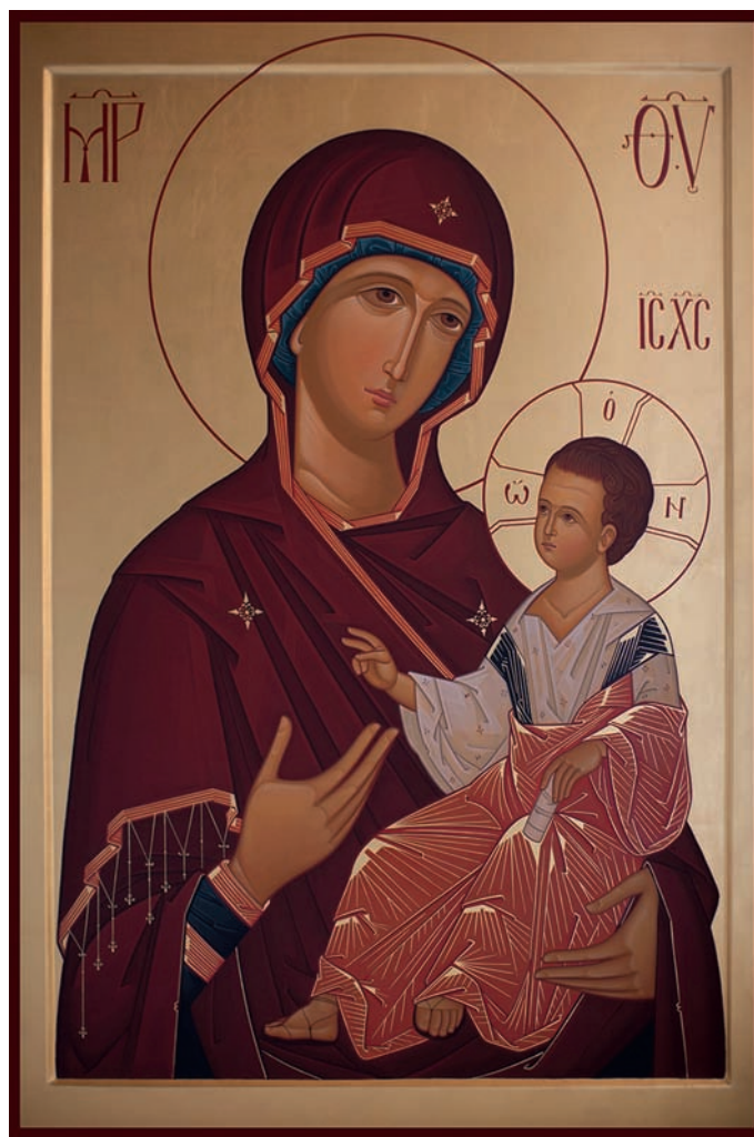
Her er det ferdige ikonet