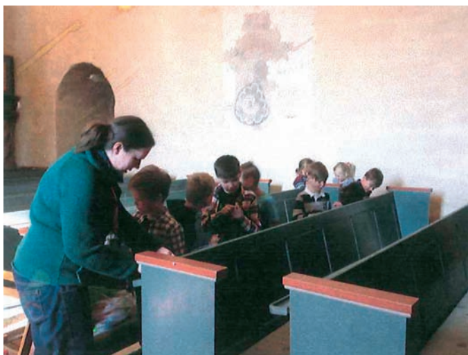
Ei av oppgåvene andreklassingane fekk tårnagenthelga var å finne att kommunevåpenet i kyrkja.