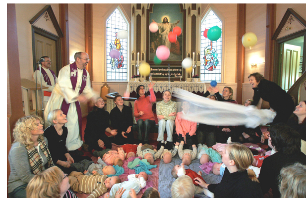
Det er mer enn 859 000 døpte barn og unge mellom 0 og 18 år

Prosjektene leverer årlig årsrapport med tiltaksrapporter. Det ligger nå ca 1000 tiltaksrapporter i ressursbanken samt en rekke mer fyldige beskrivelser av enkelt tiltak som ressursmaterieell for andre menigheter.. Ressursbanken finnes på www.kirken.no/storstavalt