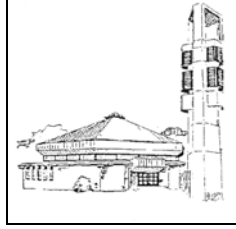
Spjelkavik kirke Kulturutvalget