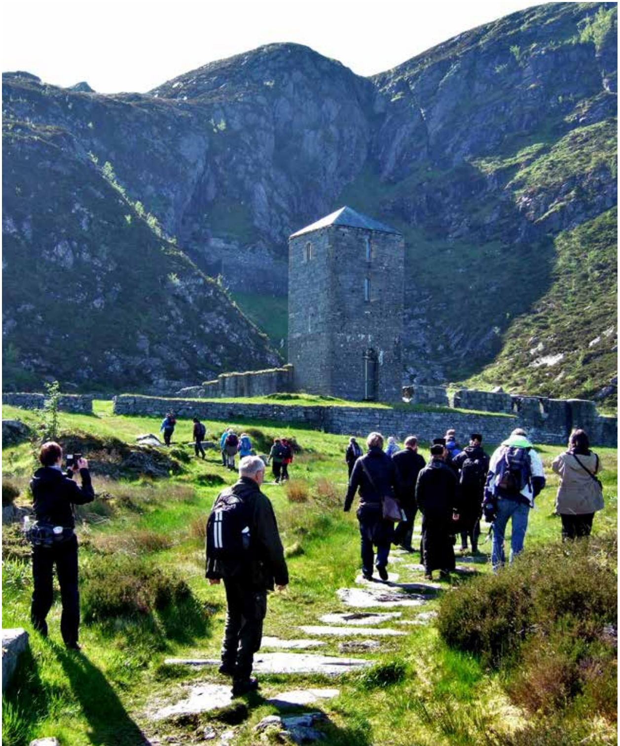
Pilegrimene ankommer klosteret på Selja.