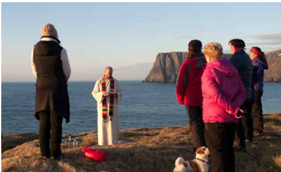
Klimapilegrim 2015 ble innledet ved bønn for skaperverket på Nordkapp i juni.

KNUT REFSDAL, Generalsekretær i Norges Kristne Råd