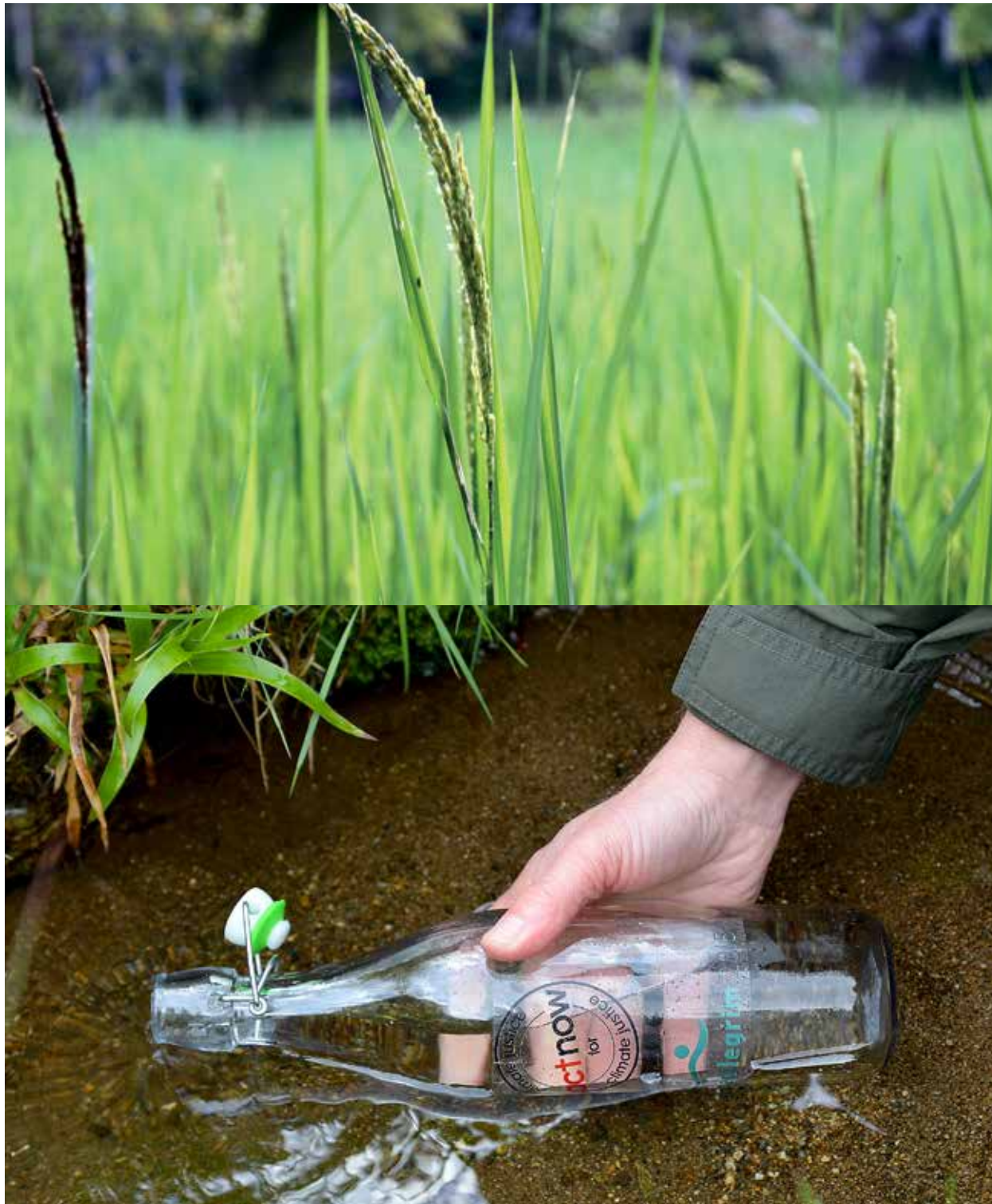
Vann fra hele Norge ble samlet inn i løpet av sommermånedene 2015. Her fra St. Sunnivakilden på øya Selja.