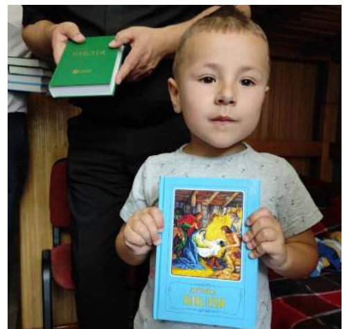
En liten flyktninggutt fikk sin egen barnebibel under Bibelutdeling til flyktninger i Lviv. Her i Pinsemenigheten Golgatha.