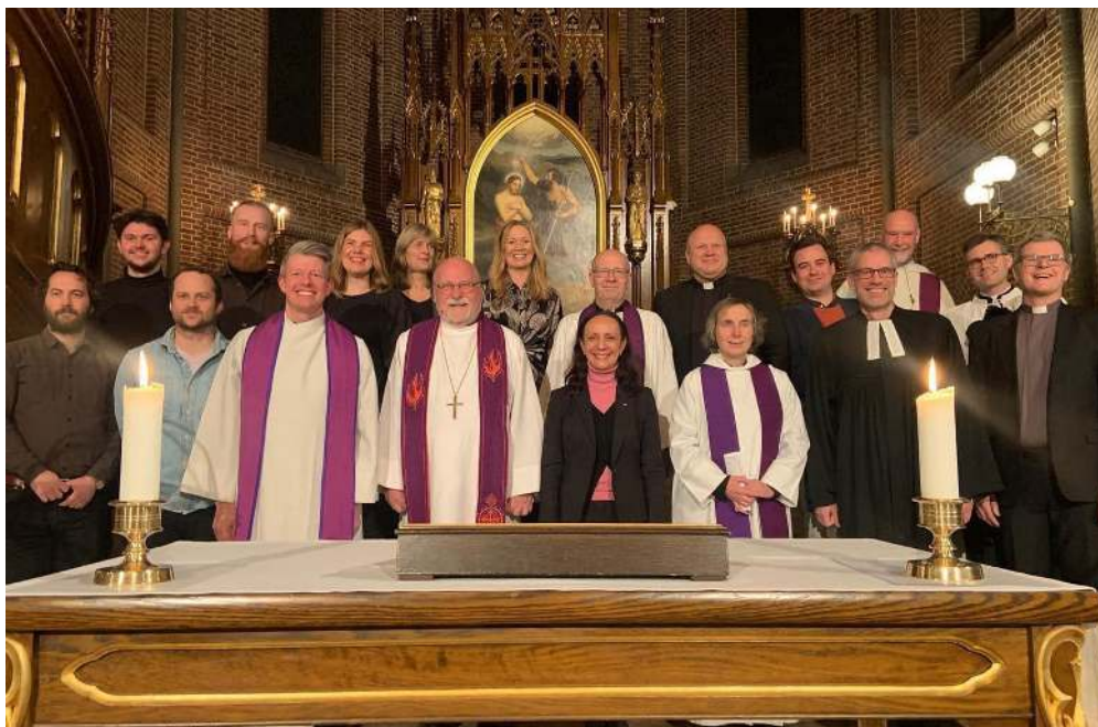
Kirkelederne som deltok på fredsgudstjenesten i forbindelse med utdelingen av Nobels Fredspris.