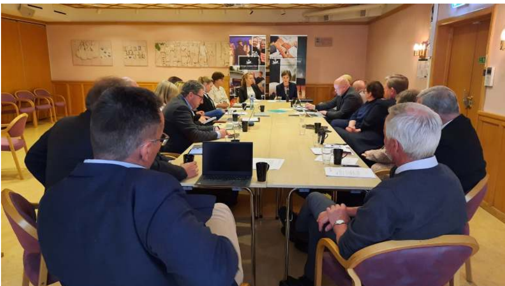
Fra styremøte med barne- og familieminister Kjersti Toppe.

Andre tema som ble berørt var kirkenes rolle under pandemien, og koronakommisjonens rapport, den nye tros- og livsynssamfunnsloven, og uklarheter knyttet