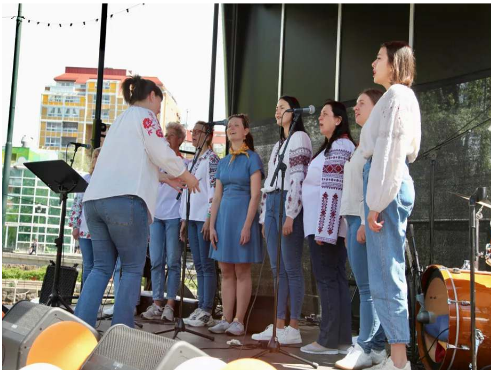
Norsk-ukransk vokalensemble Folkemelodi på Pinsefestival 2022.