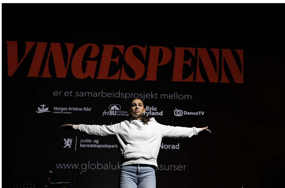
Fra Vingspennframvisningen på trosopplæringskonferansen 2022.

Global uke er en årlig uke i november der kirkene i Norge - sammen og samtidig - setter søkelys på urettferdighet slik den viser seg gjennom menneskehandel og grov utnyttelse, ofte kalt moderne slaveri. Norges Kristne Råd koordinerer arbeidet. Tiltaket mottar støtte fra Norad, Justis- og beredskapsdepartementet og Kirkens Nødhjelp.