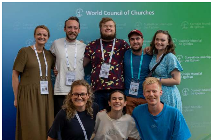
Den norske ungdomsdelegasjonen til EYG.

I fem dager (26-31 august 2022) var 7 ungdommer fra fire ulike kirkesamfunn i Norge (Den norske kirke, Pinsebevegelsen, Frikirken og BCC) samlet i Karlsruhe i Tyskland sammen med 400 ungdommer fra resten av verden. Anledningen var økumenisk ungdomssamling som pre-assembly for generalforsamlingen regi av Kirkenes Verdensråd.