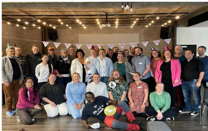
Deltakerne på studieturen med NMS og Norges Kristne Råd juni 2022 til Carlisle i England.