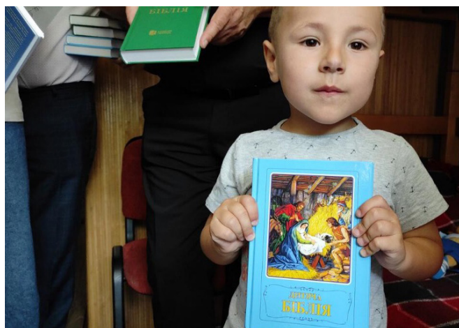
FIKK BARNEBIBEL: Denne gutten var på flukt og fikk en barnebibel utdelt av pinsemenigheten Golghata i Lviv.