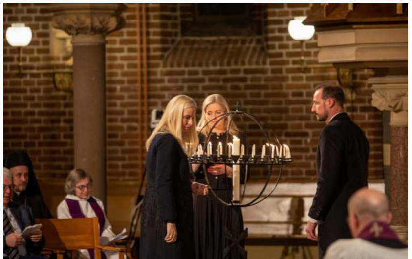
H.K.H. Kronprins Haakon, Kronprinsesse Mette-Marit og justisminister Emilie Enger Mehl (Sp) tenner lys for Ukraina under fredsgudstjenesten.

og samfunnet i sin helhet for å kunne ta ukrainske flyktninger godt imot. Vi oppfordret menigheter til å kontakte og støtte kommunene. Selv om det er et offentlige myndigheters ansvar å administrere flyktningstrømmen, var det selvfølgelig at de kunne ikke utføre jobben uten støtte fra sivilsamfunnet. Vi oppfordret også menighetene til å åpne kirkene og forsamlingshus, leirsteder og andre ressurser for bo- og mottakstilbud. Det var gjennom den