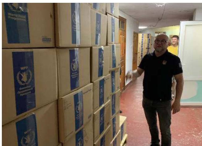
DELER UT MAT: Baptistkirken Bethany i Bucha deler ut mat til mennesker på flukt på vegne av Verdens matvareprogram.