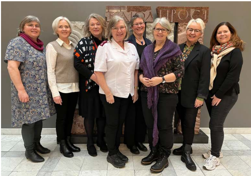
Komiteen for kvinnes internasjonale bønnedag.

men Det Norske Bibelselskapet som inntil i fjor har stått for utsendelsen av materiell, sendte dette til lokale arrangører.