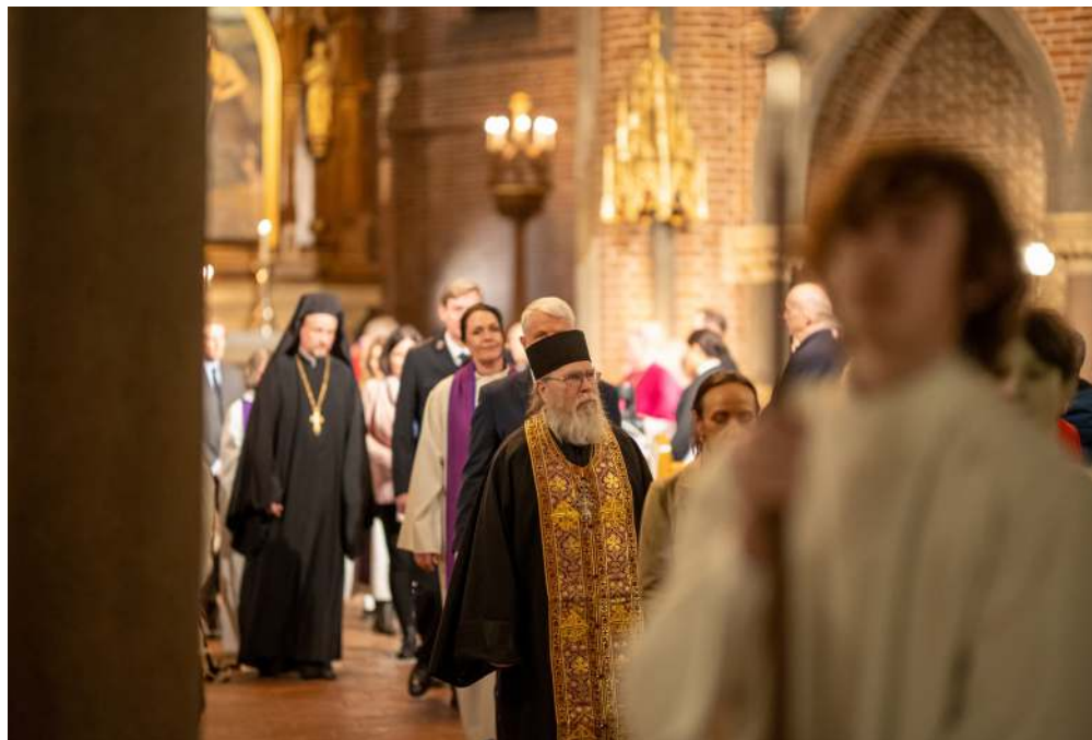
Prosesjon på den økumeniske fredsgudstjenesten for Ukraina.

åpenhjertede varme mottakelsen at norske kommuner greide å bosette rekordmange flyktninger i fjor. Mange menigheter rundt om i landet har vist sterkt engasjement og gjestfrihet i møte med flyktninger. Vi har bistått med etterspørsel om ressurser, kontakt og kunnskap om de ukrainske flyktingers religiøse og kirkelige tradisjoner. Det var betryggende å merke at humanitet og gjestfrihet vant over fremmedfrykt og skepsis i denne tiden.