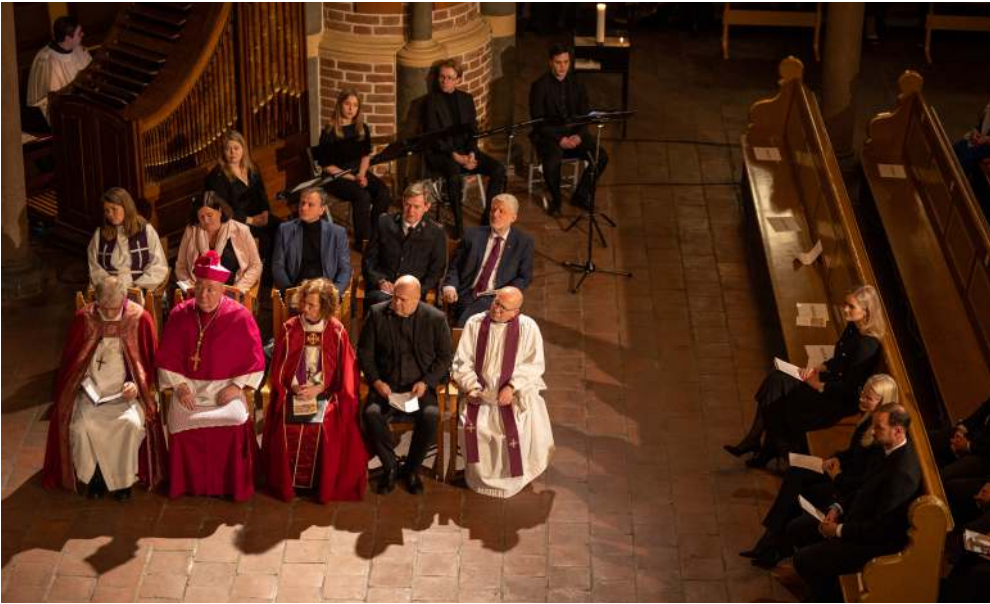
Bred deltakelse på fredsgudstjenesten for Ukraina fra kongehuset, regjering, myndigheter og kirke-Norge.