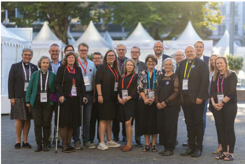
Den norske delegasjonen samlet på generalforsamlingen til Kirkens Verdensråd.