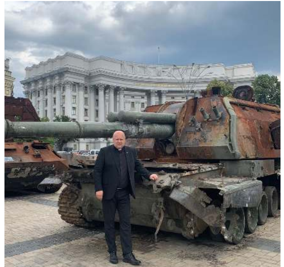
Krigen preger hele bildet.

– For meg ble det et veldig emosjonelt møte. Da jeg skulle dele noen tanker med dem, begynte tårene bare å renne, Jeg så på disse, som gjør så mye – for så mange, flere av dem fullstendig avskåret fra sine nærmeste på grunn av krigen. Det gjør så vondt, så vondt – og så fikk jeg likevel, også gjennom tårene, dele noe ord og en hilsen fra kirkene i Norge.