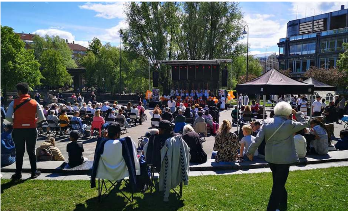
Pinsefestival 2022.