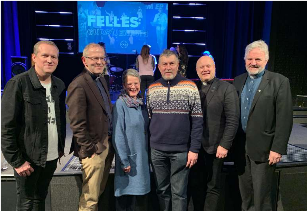
Bilde fra fellesgudstjeneste i OKS Romerikskirken

Det ble videre identifisert fire områder som kan styrke lokaløkumenisk arbeid: