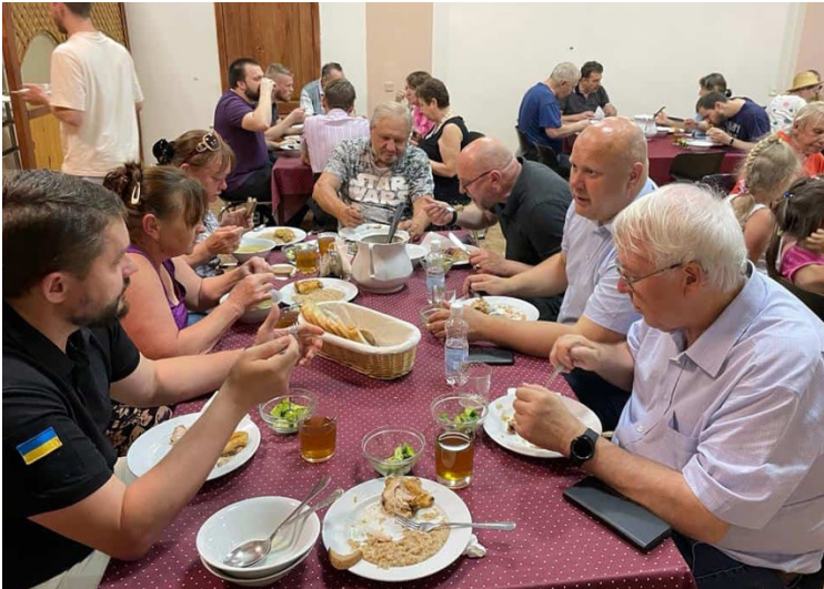
Matutdeling ved Ukrainian Evangelical Theological Seminary.