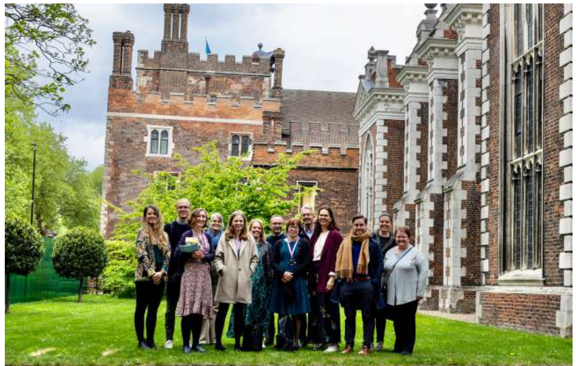
Styringsgruppen på studietur i England.