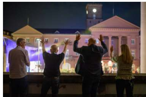
Noen av de norske kirkelederne som deltok på generalforsamlingen til Kirkenes Verdensråd under åpningsdagen.

ralforsamlingene som tar plass hvert 8 år. Sentralkomitéen er ansvarlig for å gjennomføre vedtakene gjort av forsamlingen, gjennomgå og føre tilsyn med KV-programmene og administrere KV sitt budsjett.