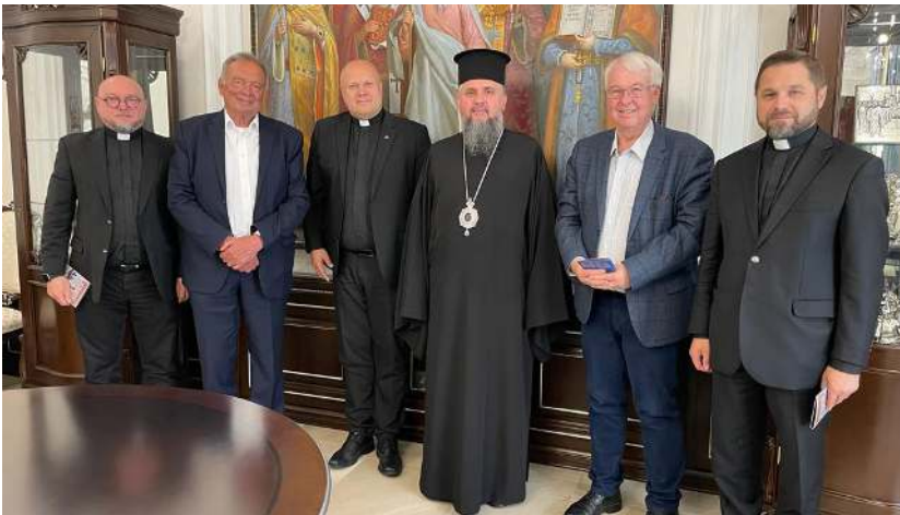
Møte med Metropolitt Epiphaniy av Kiev og hele Ukraina, i den ortodokse kirke i Ukraina.