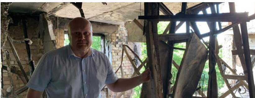
Hermansen møtte skrekkelige ødeleggelser.

Folk hadde løpt til kirken for å gjemme seg i kjelleren, mens soldatene marsjerte fra hus til hus – helt til kirken. Utenfor ropte de den ansvarlige ut – og spurte hva han gjorde der nå. Han kunne ikke annet enn å si det som det var – at de beskyttet befolkningen mot bomber.