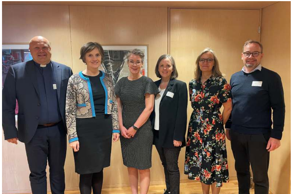
Møte med barne- og familieminister Kjersti Toppe sammen med bl.a. representant for STL.

funnene våre, og vi ser også at arbeidet gir frukter – om enn mindre enn vi kanskje skulle ønsket.