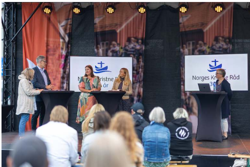
Fra debatten om underordning.

Vi fortsatte med flyktningtematikk på kirkeskipet senere på dagen med tema: Ingen er så trygg i fare – om flyktninger og menneskehandel. Hva gjør vi i Norge for å gi flyktninger rask tilgang til bolig, utdanning og jobb? Hvordan kan vi forhindre