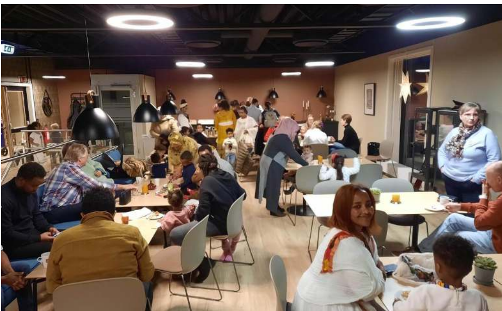
Torsdagskafé i Frelsesarmeen Skien markerte også Global uke.