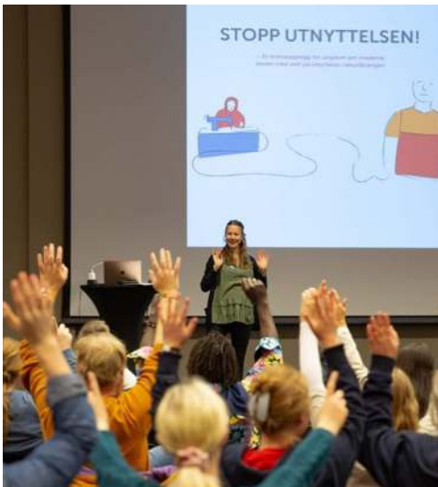
Dramaverktøyet Stop utnyttelsen! i bruk.