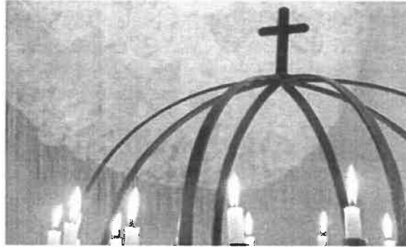
Sjømannskirken i New York (altertavle)

Generalforsamlingen (GF) består av 90 delegater: 25 fra kretsene/foreningene i Norge, 33 fra kirkene/stasjonene ute, og Dnks delegasjon teller 5* pluss Bjørgvin biskop. I tillegg kommer representanter fra de ulike fagforeningene, hovedstyrets medlemmer og ledergruppen v/hovedkontoret (møter uten stemmerett).