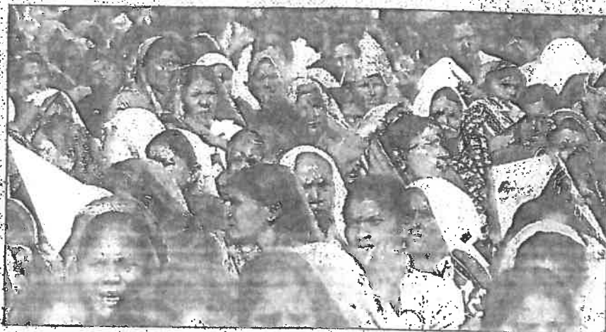
UBERØRBARE: Norge kan ta til ordet for at indiske og pakistanske myndigheter må motarbeide diskriminering av daliter, skriver forfatterne.

Ekstrem fattigdom, mangel på ressurser og sosial ekskludering tvinger daliter til å ta ugunstige lån som binder deres arbeidskraft til utlåner. «Bundet arbeid» er en