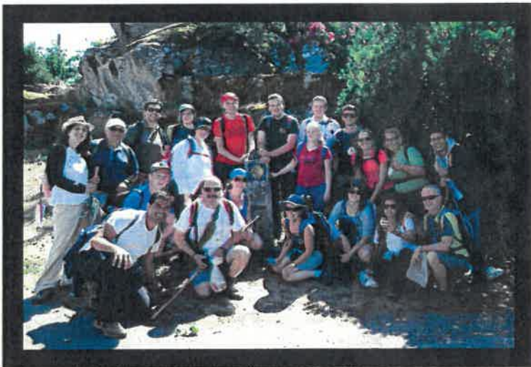
Gjengen klar for tur! Atten pilegrimer fra åtte forskjellige land, pluss support team .

Hverdagen er omsider i gang igjen. Jeg er tilbake i Oslo og skriver halvhjertet på min masteravhandling. En stor del av hodet, og hjertet mitt, er fortsatt vandrende langs landeveien i nordvest-Spania, med smilende, leende ansikter og vakker natur rundt meg, i et tett og sterkt fellesskap som vil meg vel.