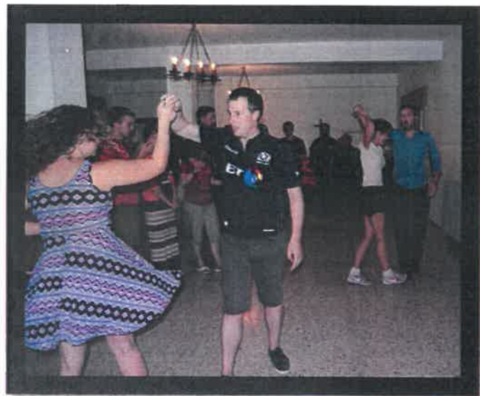
Svingende pilegrimer i fri utfoldelse

Etter det kulturelle innslaget spiste vi middag sammen, der bordverset selvfølgelig var på kveldens språk. Da vi hadde spist oss gode og mette (vi fikk all mat laget og servert av «support-teamet» som gjorde en hederlig innsats hele uka), avsluttet vi kvelden med eveningprayer . Her fikk vi lære sanger og bønner på flere ulike språk, og vi fikk selv lære bort. I tillegg var det her også rom for deling av personlige erfaringer. Det ble delt mange