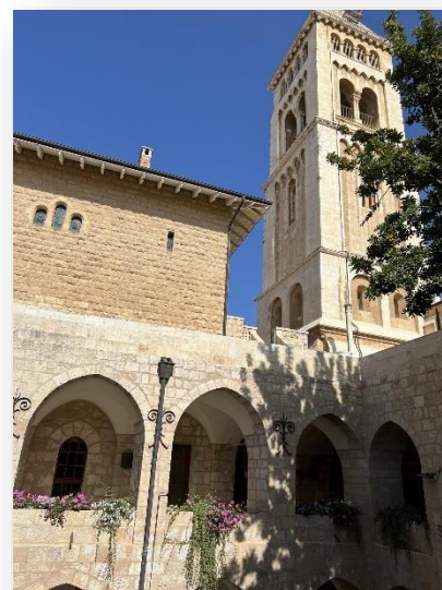
Redeemer Church i Jerusalem