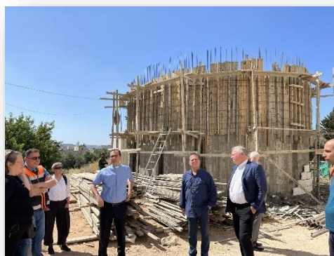
I tilknytning til byggeprosjektet i Betlehem bygges også et nytt kapell i tilknytning til kirkegården rett bak forretningsbygget

Kirkens likviditet er elendig, så det var spørsmål om man ville klare å utbetale lønninger til de ansatte i juni. Kirken står selv for om lag 80 % av inntektene, mens resten kommer fra partnerkirker. Det er et problem at mye av midlene fra partnerne er øremerket til enkeltmenigheter og prosjekter, noe som gir kirken liten fleksibilitet til å styre økonomien til beste for hele kirken. Partnerne oppfordres derfor til å gi ikke-øremerkede midler, noe vi alt gjør fra Kirkerådets side.