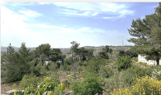
Miljøsentret med utsikt mot israelske settlements

Gjennom det omfattende skolearbeidet når kirken ut til mange i lokalsamfunnet. De fleste elevene er muslimer, noe som også gjelder for det flotte speiderarbeidet. Den lutherske kirkens samfunnsinnsats er langt større enn antall medlemmer på rundt 2000 skulle tilsi. Denne gangen har jeg lagt ved hele rapporten fra kirken hvor man kan lese om lokalt menighetsarbeid i tillegg til andre aktiviteter.