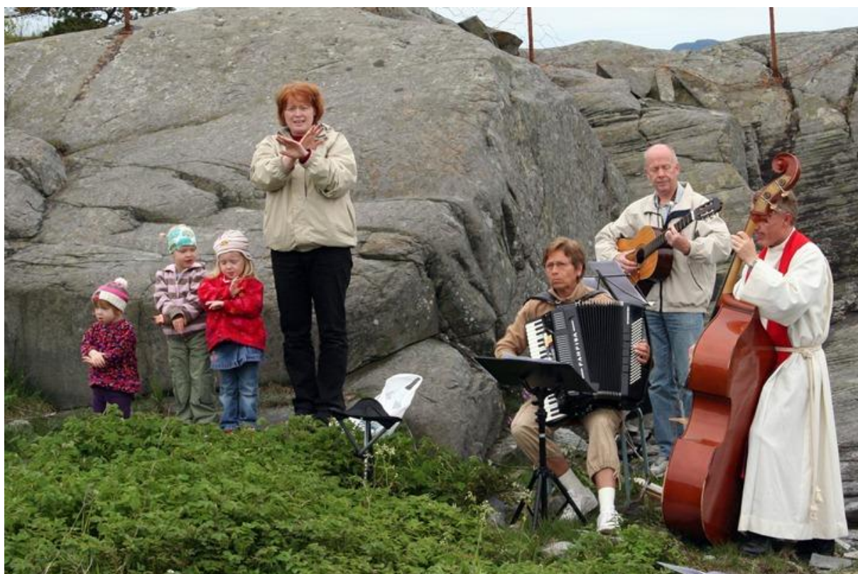
Friluftsgudstjeneste og feiring av Skaperverkets dag i Fusa menighet, 2.pinsedag på Vinnesholmen.

Bruk langbordet som fellesskapsbord for kirkekaffe/te/saft. Lag et delemåltid med frukter, brød og andre matvarer som gudstjenestedeltakerne har medbrakt.