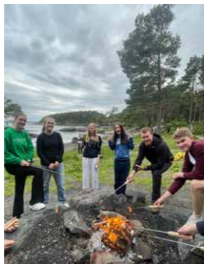
Topp stemning på Ungdomstunets sommaravslutning i Ervikane i juni