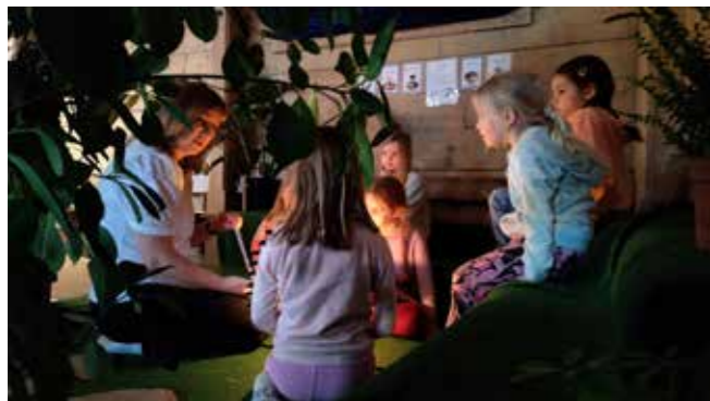
Spennande å site i "Getsemane-hagen" og undre seg i lag på Påskevandring.