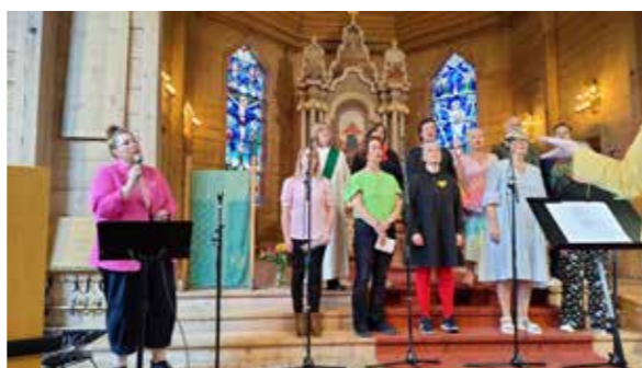
Fonos deltok med fargerik song under regnbogegudstenesta i Os kyrkje 19. juni.