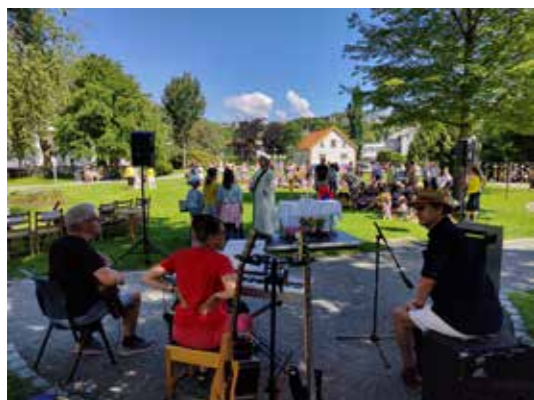
Det er alltid fullklaff med sommarvær når Skapingsdagane avsluttast med gudsteneste på Kyrkjeflaten!