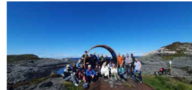
Kyrkjestaben i Os og Fusa reiste til "Livets Portal" i Telavåg på sommaravslutning - godt vær og godt turfølgje!