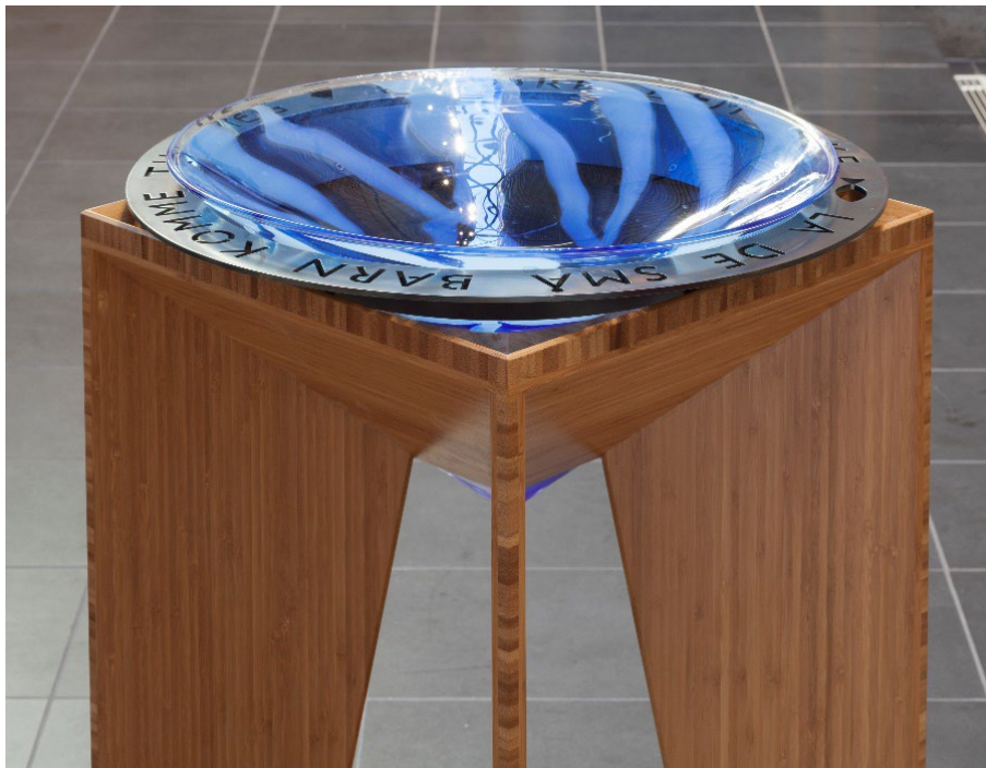
«Her e det et lite barn som kommer, [...] i ei kirke i en hellig dåp.» NoS 2013, nr. 592 Tekst og melodi: Kari Bremnes

Den mangfoldige og økende interessen fra mennesker som vil inn i kirkene, viser behovet for et åpent rom som kan favne livet, gi rom for undring og mulig tilhørighet. Få andre steder i dagens samfunn har slike rom. Både pilegrimer og andre som tilfeldigvis kommer forbi, bor i nærheten eller har reist langt, bærer med seg dette ønsket: å få komme inn i stedets kirke.